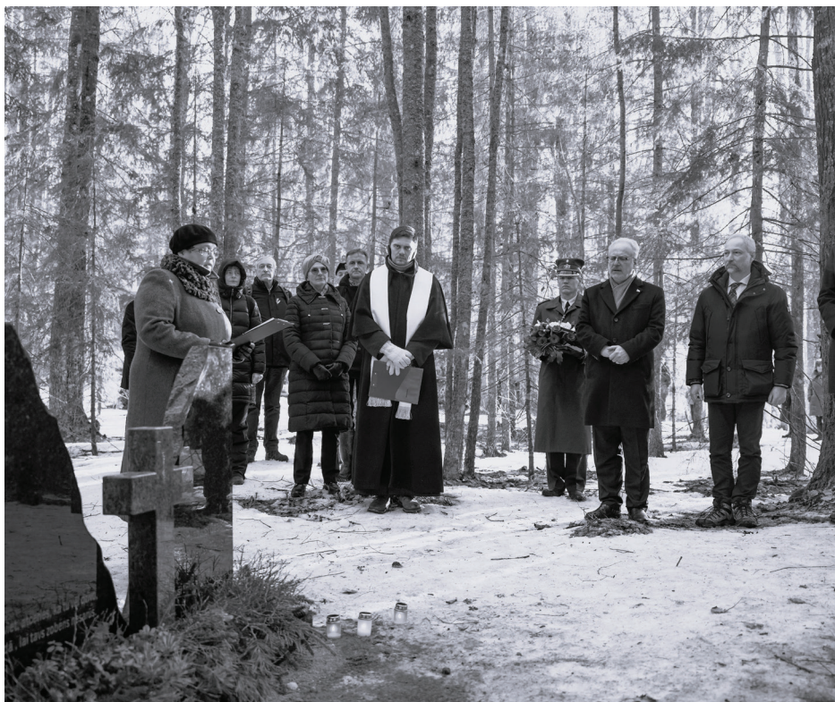
Atzīmējot Nacionālo partizānu bruņotās pretestības atceres dienu, tika iesvētīta un svinīgi atklāta piemiņas zīme Stompakas apglabātajiem nacionālajiem partizāniem. To veidoja SIA "Tako SD".

Dabas liegums "Stompaku purvi" ir unikāla teritorija ar dabas bagātībām un kultūrvēsturisko mantojumu. Purva austrumu daļas salās 2. Pasaules kara laikā bija ierīkota partizānu apmetne, kura bija lielākā Baltijā un Ziemeļeiropā. Tajā bija 24 bunkuri un vairākas virszemes būves. Uz Nacionālo partizānu mītnēm dabas liegumā "Stompaku purvi" ved marķēta taka, mitrākajās purva vietās ierīkotas laipas.