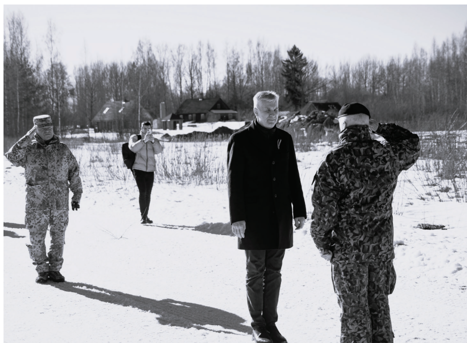
Aizsardzības ministrs Artis Pabriks Balvu novadā ieradās ar lidmašīnu, kura piezemējās Balvu pagasta lidlaukā.