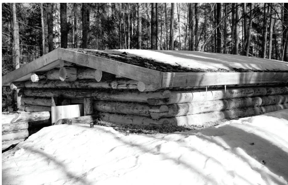
Stompaku bunkura-baznīcas rekonstrukcija sāka 2021. gadā un veikta ar Zemkopības ministrijas un AS "Latvijas valsts meži" atbalstu, uzklusot vēsturnieku un laikabiedru atmiņu stāstus