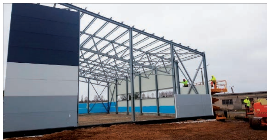
Norit darbi Brīvības ielā 1K, Balvos.