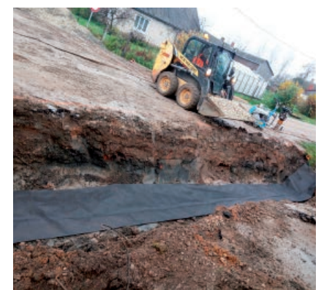
Noris ārējo ūdensvada un kanalizācijas tīklu izbūve Ķiršu ielā, Balvos.