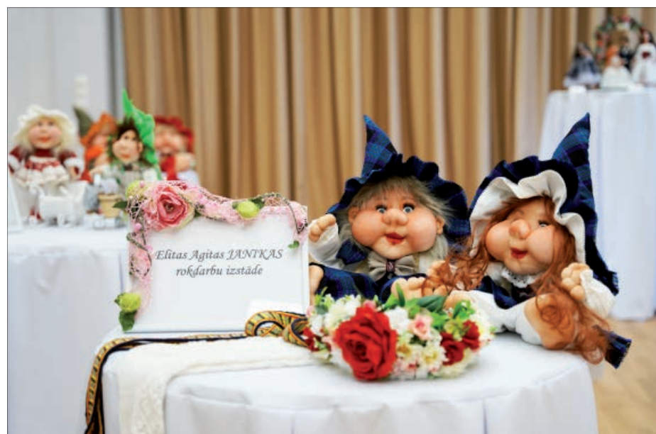
Balvu Kultūras un atpūtas centrs savas durvis apmeklētājiem vēra ar divām izstādēm Dienvidu un Ziemeļu stikla zālēs.