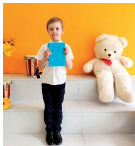
Gustavs Logins- KĀRTĪGĀKAIS dziedātājs