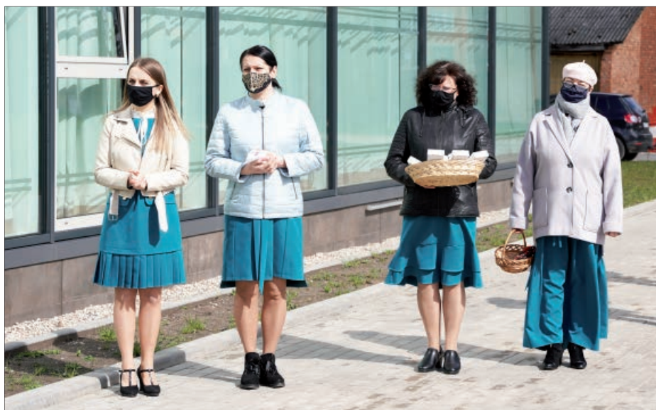
Balvu Kultūras un atpūtas centra darbinieki šo dienu gaidīja ilgi, lai arī pasākumi jau izplānoti visam gadam, tomēr pašreizējā situācija neļauj organizēt plašus kultūras pasākumus, tikmēr viņi ir atraduši veidu, kā kaut nedaudz, bet atvērt durvis apmeklētājiem.