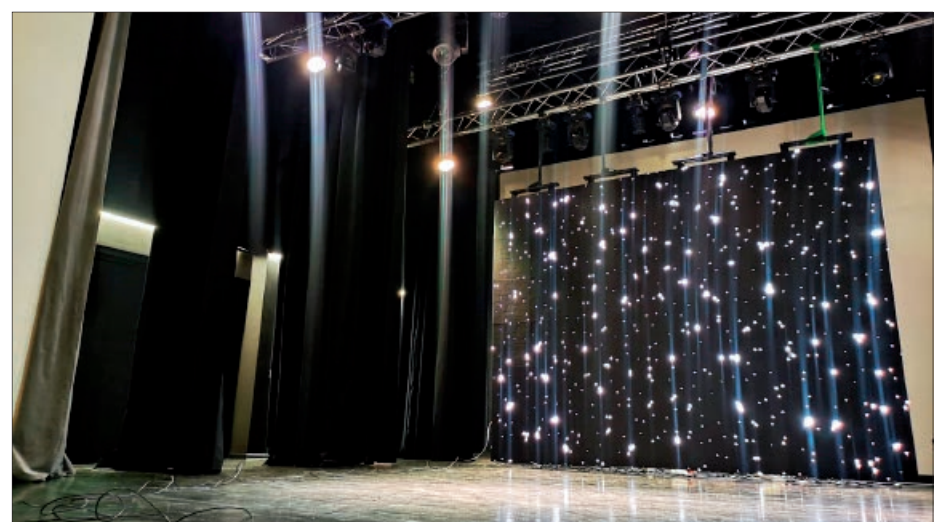
Jaunais LED ekrāns papildina skatuves noformējumu.