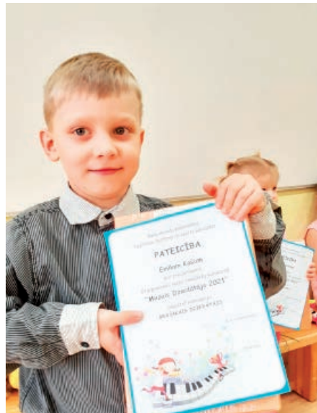
Emīls Kašs- BRAŠĀKAIS dziedātājs.