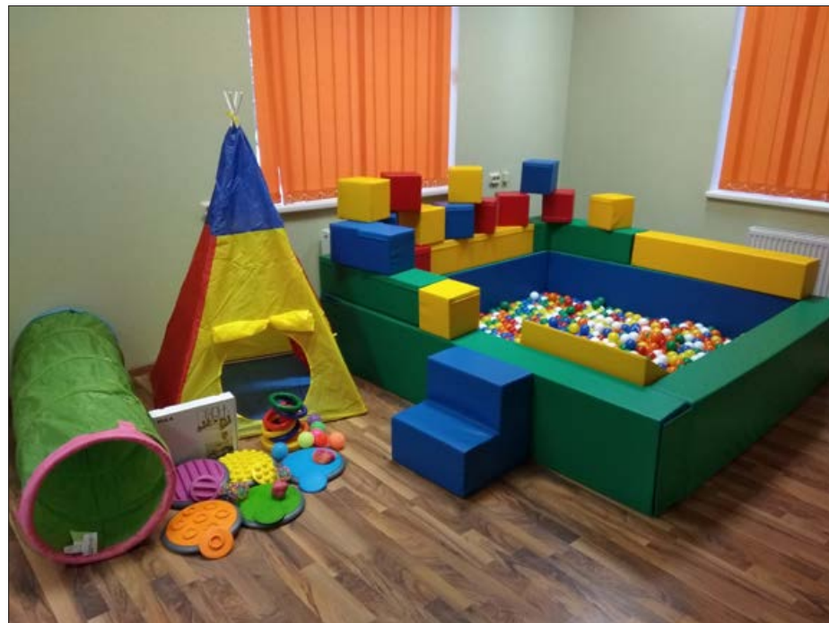
Lietošanai gatavs jau ir liels bumbu baseins ar papildus Iglu klučiem, lai bērni aktīvi varētu izpausties aktīvā atpūtā un rotaļās.