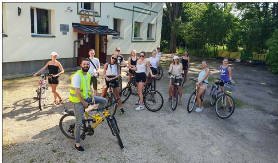
Pirmā riteņbraukšanas aktivitāte Balvi-Verpuļeva-Rubeņi-Balvi.

Jaunatnes darbs šajā gadā izjuta izmaiņas, taču jāatzīst, ka darbs ar jauniešiem notika tiešsaistē un