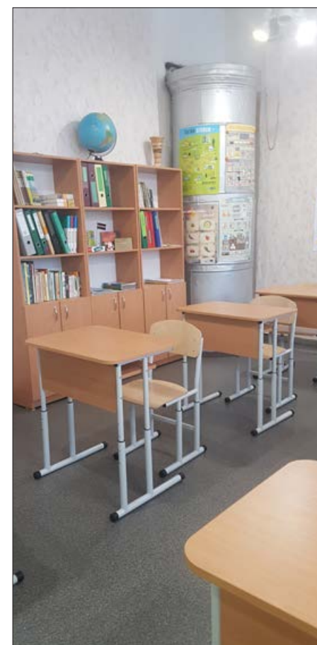
Vīksnas skolā tiek domāts par skolēnu labsajūtu un mācību vides uzlabošanu, piemēram, šogad dabas zinību kabinetam iegādāti četri biroja plaukti.

Ir tik patīkami saņemt pateicības vārdus no skolas komandas un vadītājas, priecājamies būt arvien noderīgi, sadarboties un kopā virzīties uz priekšu vien. Paldies, ka mums,