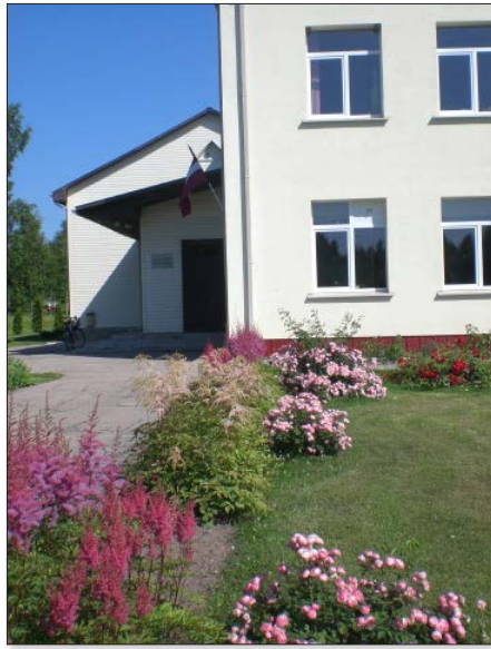
Viksnas skola un tās apkārtnē, kā arī līdz šim, tiek uzturēta pastāvīgā kārtībā, tiek kopts pagalms, apstādījumi, tiek pļauta zāle, un kopējais tēls arvien liecina, ka skolā ir dzīvība.