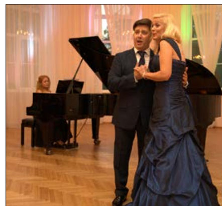
Augusta pēdējā nedēļā Balvu muižas koncertzālē notika 21. Kamermūzikas festivāls, pulcējot klausītājus uz četriem dažādiem koncertiem.