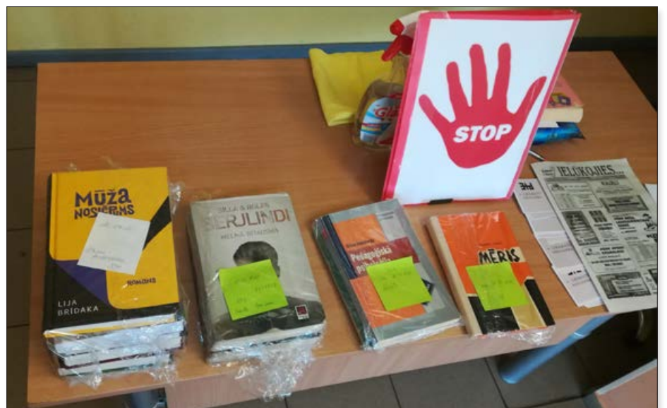
Attālināti rezervētās grāmatas gaida savu lietotāju.

bibliotēkām tas bija bagātīgs krājuma papildinājums.