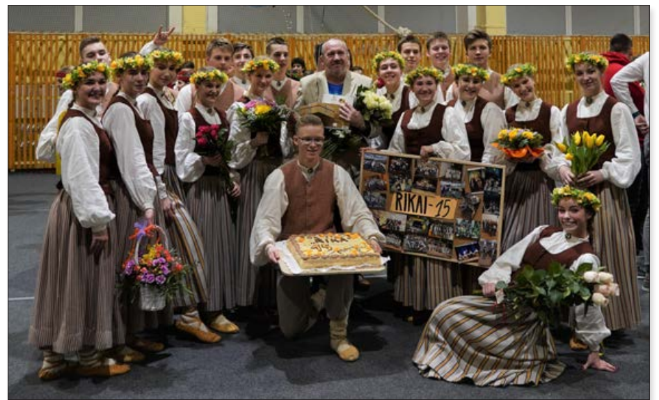
Februāra nogalē ar jestrū dejas soli 15 gadu jubileju nosvinēja arī Balvu Kultūras un atpūtas centra jauniešu deju kolektīvs "Rika".