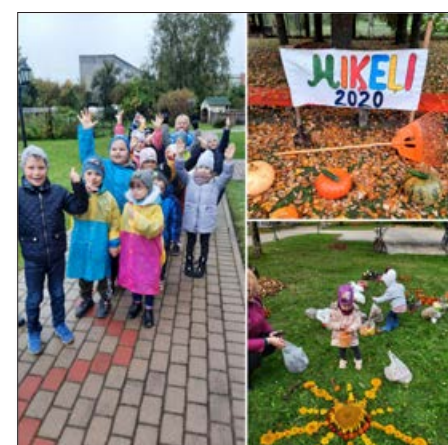
Visa gada garumā PII "Pīlādžītis" cenšas plānot un organizēt daudzveidīgus pasākumus un aktivitātes āra vidē.

Noteikti drosmīgus, radošus, uzņēmīgus, izlēmīgus bērnus un jauniešus.