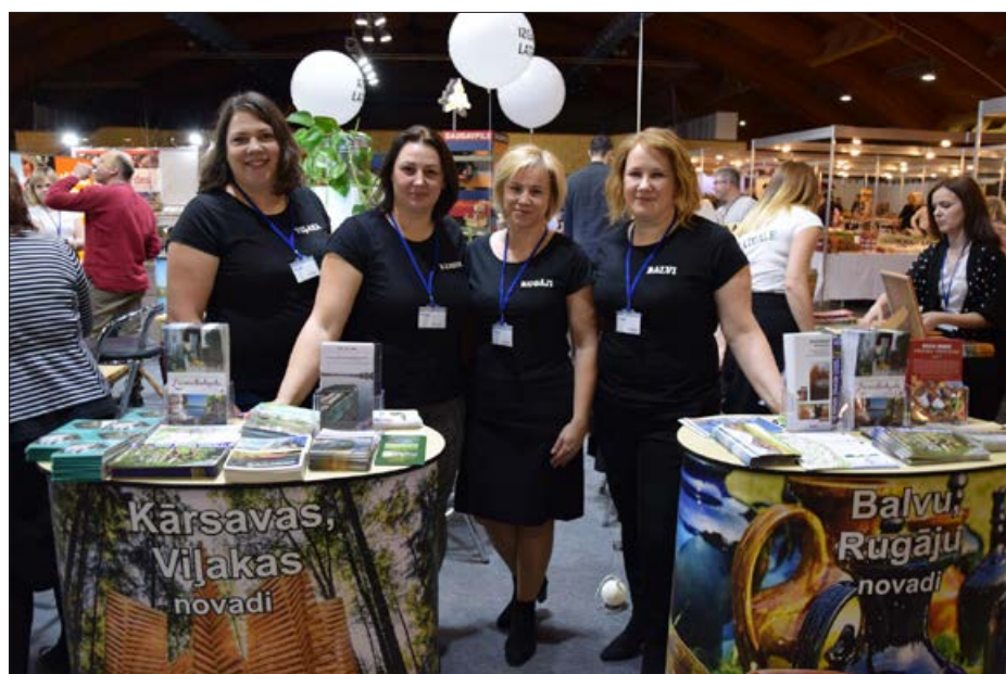
Katru gadu februārī tūrisma izstādē "Balttour" Rīgā Latgales reģiona vienotajā stendā tiek pārstāvēts arī Balvu novads. Par tūrisma un atpūtas iespējām, lielākajiem pasākumiem Balvu novadā izstādes trīs dienās interesējas simtiem apmeklētāju, un šogad biežāk uzdotie jautājumi bija par atpūtu pie ezeriem, dabas takām un velomaršrutiem, kā arī par vietām, ko apmeklēt kopā ar bērniem.

Ziemeļlatgales biznesa un tūrisma centrs