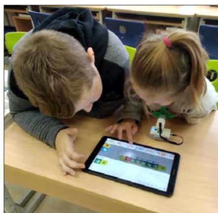
Balvu sākumskolā mācību process arvien vairāk tiek digitalizēts, grāmatas daudzos gadījumos tiek aizstātas ar planšetdatoriem.