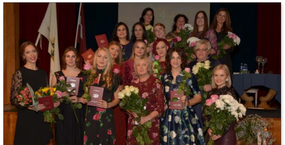
Oktobra beigās BPVV notika pirmais izlaidums profesionālās vidējās izglītības programmas "Vizuālā tēla stilists" absolventēm. Šogad diplomus par profesionālo vidējo izglītību saņēma 11 topošās skaistuma radītājas - vizuālā tēla stilistes.

Profesionālās izglītības jomā noslēgts sadarbības līgums ar uzņēmumu SIA "Kokpārstrāde 98", kur izglītojamie īsteno kvalifikācijas prakses un turpina darba attiecības pēc tās. Sadarbība notiek arī vasaras brīvlaikā, kad izglītojamie, kuri sasnieguši 18 gadu vecumu - gan puisi, gan meitenes, labprāt uzsāk darba attiecības. Uzņēmums ir mecenāts nodibinājuma "Vītola fonds" stipendijai, kur izglītojamie turpina saņemt arī apmaksātās kvalifikācijas prakses laikā uzņēmumā.