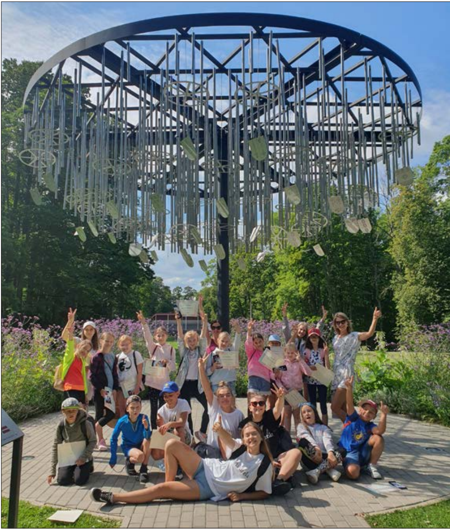
Šogad neizpalika arī nometne "Krāsainā vasara", kurā 16 bērni varēja radoši, aktīvi un interesanti pavadīt laiku, strādājot gan individuāli, gan grupās, mācoties sadarboties un saliedēties.

video materiālus par aktivitātēm, cītīgi apgūst latviešu valodu. Ir patiesā sajūsmā par Latvijas dabu un cilvēkiem. Gada posmā apgūtā nauda no Eiropas Solidaritātes korpusa grantiem ir apmēram 14 tūkstoši.