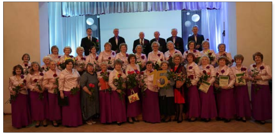
Janvārī 15 gadu jubileju ar skanīgu koncertu "Dziedot mūžu dzīvojam" nosvinēja Balvu Kultūras un atpūtas centra senioru koris "Pīlādzis".

Augusta beigās norisinājās 21. Balvu Kamermūzikas festivāls ar