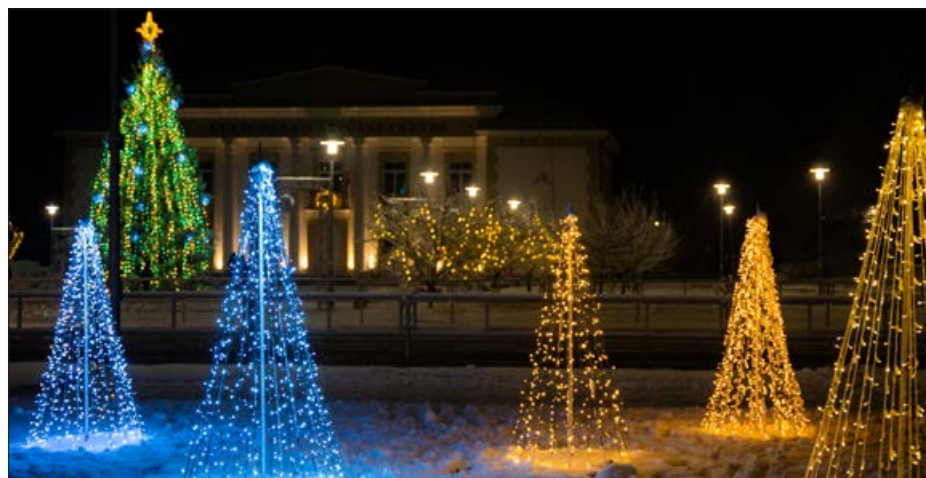
Decembri Balvu Kultūras un atpūtas centra kolektīvs velta jaunu dekoratīvu objektu izveidei pilsētā.