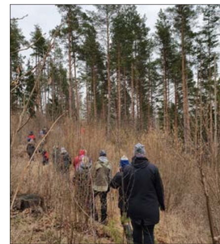
Brīvdienų piedāvājums ar vienotu nosaukumu "Izbaudi ziemu Ziemeļlatgalē" šogad Balvu un tuvākajos kaimiņu novados norisinājās jau piekto gadu un pulcēja plašu apmeklētāju loku, kas vēlas iepazīt tūrisma vietas un piedalīties meistardarbnīcās, pārgājienos arī Balvu pusē.

Tūrisma informācijas centrs par aktivitātēm tūrisma nozarē informē sociālajā tīklā facebook @BalvuNovadaTic lapā, kur tiek sasniegta plaša auditorija, kā arī nemitīgi tiek pilnveidota un uzturēta Balvu novada tūrisma lapa turisms.