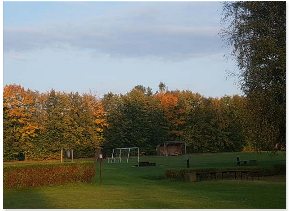
Lai arī sporta dzīve noklususi, tomēr skolas stadions gaida kā mazos, tā lielos sportotgribētājus.