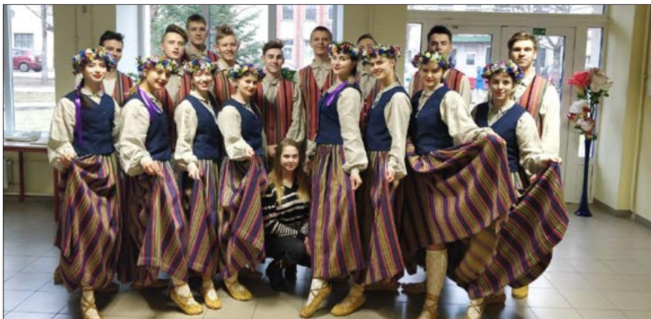
Skolas tautu deju kolektīvs "Kastanis" individuālās nodarbībās turpina gatavoties Latvijas Skolu jaunatnes dziesmu un deju svētkiem.