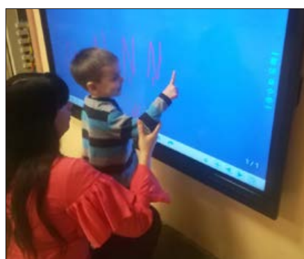
Četrās pirmsskolas izglītības iestādes grupiņās šogad ir iegādāti interaktīvie ekrāni, kur piecgadnieki un sešgadnieki ar pedagogu palīdzību apgūst jaunās digitālās prasmes.

- jaunas grupas atvēršana, divu jaunu nojumju - āra klašu atvēršana un 4 interaktīvo ekrānu iegāde.