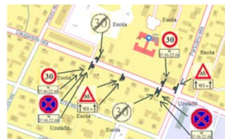
Satiksmes organizācijas shēma Daugavpils ielā, Balvos.

Attālinātajā domes sēdē lēma atļaut uzstādīt 2 aizlieguma ceļazīmes Nr. 326 "Apstāties aizliegts" un 2 papildzīmes Nr. 828 "Darbības laiks" Daugavpils ielā, Balvos, saskaņā ar satiksmes organizācijas shēmu,