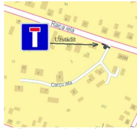
Satiksmes organizācijas shēma Ceriņu ielā, Balvos.

kā arī lēma atļaut uzstādīt 1 informācijas ceļazīmi Nr. 711 "Strupceļš" Ceriņu ielā, Balvos, saskaņā ar satiksmes organizācijas shēmu.