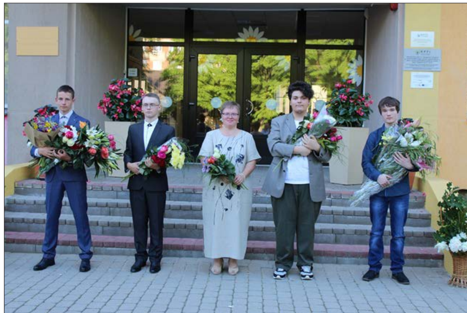
Balvu sākumskolai (foto vēl pamatskolai) šis gads ieies vēsturē ar to, ka notika pēdējais mazākumtautību izglītības programmas izlaidums.

2020.gadā tika īstenots projekts „Balvu novada vispārējās izglītības iestāžu mācību vides uzlabošana”, kā rezultātā savesta kārtībā ventilācijas sistēma, izremontētas mācību telpas, sanitārie mezgļi un gaiteni, kā arī sakārtota sporta infrastruktūra, pārbūvējot stadionu. Šobrīd Balvu