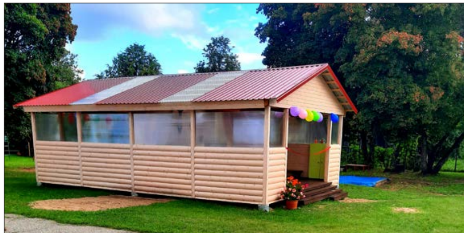
2020./2021.m.g. Balvu PII "Pīlādžītis" sākās ar jaunas āra klases - nojumes atvēršanu divām grupām 9.grupas "Vāverēniem" un 11.grupas "Pelēniem".

Otrs svarīgs nosacījums veiksmīgām pārmaiņām ir sakārtota iestādes infrastruktūra, moderni, atbilstoši mācību līdzekļi. Veikti lielāki un mazāki darbi, kas uzlabojuši mūsu dzīves vidi. Vērienīgākie notikumi bija