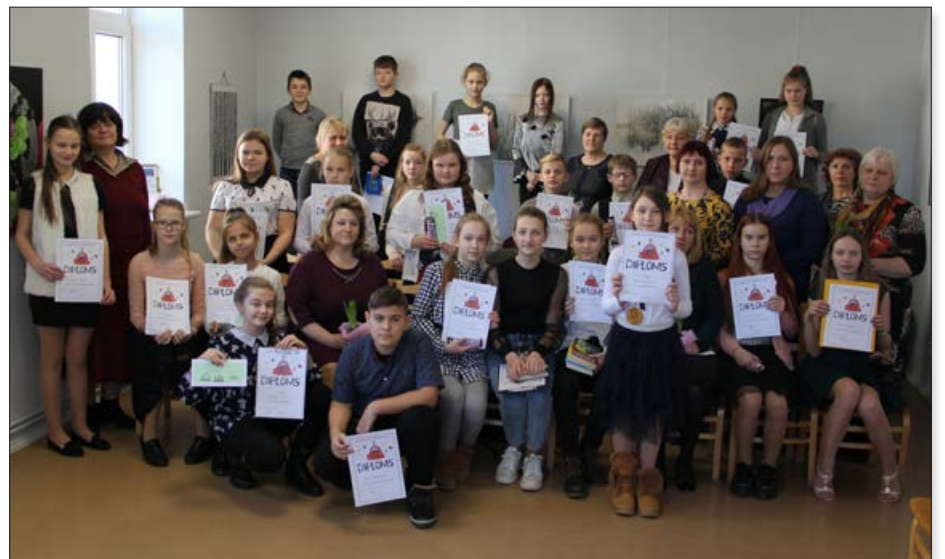
Skaļās lasīšanas sacensību noslēgums.

Bibliotēku jomai ir pietiekami daudz lietotājam neredzamu darbību. Pirmā no tām-darbs ar krājumu. Tam parasti pietrūkst laika. Balvu Centrālā bibliotēka un visas pagastu bibliotēkas šogad ir ieguldījušas ļoti daudz rezultatīva darba krājumu attīrīšanā. Darbs ar krājumu nozīmē ne tikai attīrīšanu, bet arī komplektēšanu. Mums visiem bija liels prieks, ka līdzās pašvaldības piešķirtajam finansējumam mēs varējām izmantot tā saukto Covid naudu grāmatu izdevēju atbalstam. Īpaši pagastu