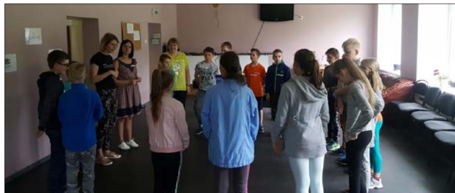
Balvu Bērnu un jauniešu centrs aicina iepazīties ar neformālās izglītības aktivitātēm, to izmantoja Balvu sākumskolas 4.b klase.

Neskatoties uz to, ka daudzi pasākumi nenotika, sakarā ar valstī