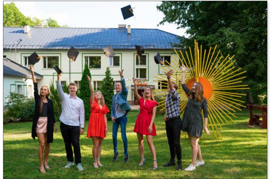
Vasaras izskaņā notika Balvu Bērnu un jauniešu centra izlaidums, kurā tiek pateikts paldies tiem jauniešiem, kuri absolvēja 12.klasi un ir organizējuši, vadījuši un nākuši ar savām iniciatīvām un idejām uz BBJC.

sociālajās platformās jau sen. Šajā laikā piedzīvotās izmaiņas pierādīja, ka cilvēks ir sociāla būtne un tam socializēšanās nepieciešama tikpat kā ūdens. Jauniešu aptaujas šajā laika posmā atklāj, cik nozīmīgas viņiem ir tikšanās klātienē. Šajā laikā jauniešiem tiek sniegts psihoemocionāls atbalsts, jaunieši tiek aicināti piedalīties fizisko aktivitāšu izaicinājumos. Šobrīd jaunieši veido BBJC Adventa kalendāru, kurš ir jauniešu aicinājums ikvienam radīt pozitīvismu savā ikdienā.