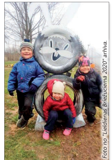
Briežusalā bērnus priecē no riepām izgatavoti jauki svētku zaķi.