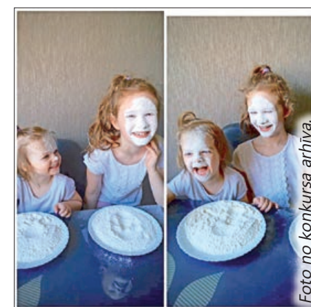
Viena no konkursam iesūtītajām fotogrāfijām.