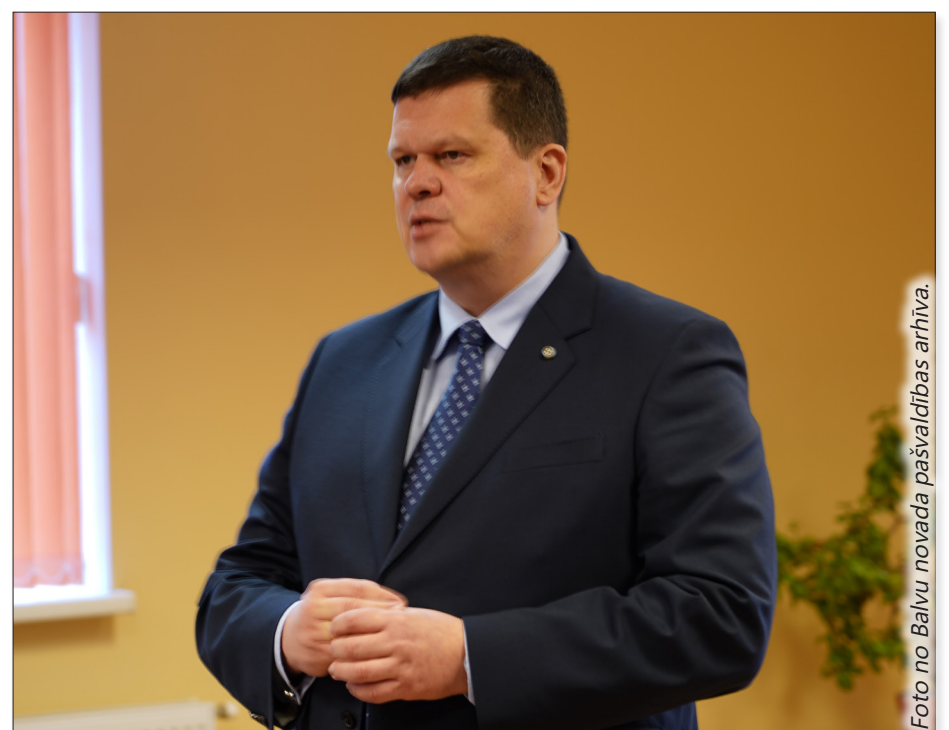
Ministrs K.Gerhards uzklausa iedzīvotāju jautājumus un aicināja zemniekus paust savu viedokli arī caur asociācijām un citām organizācijām, lai līdz gada beigām kopīgi izstrādātu visu interesēm atbilstošu daudzgadu budžeta plānu.

Dienas otrajā pusē K. Gerhards apmeklēja saimniecības Balvu un Rugāju novados, Eiropas Komisijas (EK) kampaņas "Mans reģions, mana Eiropa, mana nākotne" pasākuma "Laiks laukiem! Ko Eiropa dara kaimiņmājā?" ietvaros.