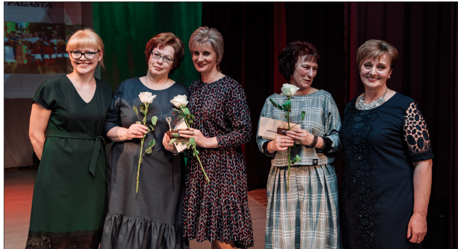
Bet par „Gada kultūras pasākumu pagastā” gan nebija tik viennozīmīgs žūrijas un iedzīvotāju viedoklis, kā rezultātā, apkopojot žūrijas vērtējumu un skatītāju balsojumu, par labākajiem tika atzīti gan Kubulu pagasta svētki “Mūs šodien visus skola sauc” , kas norisinājās no 21.-22. jūnijam Stacijas pamatskolā un tās apkārtnē, gan pasākumu kopums no 17.līdz 22.jūnijam - Tilžas Kultūras namam 80 .