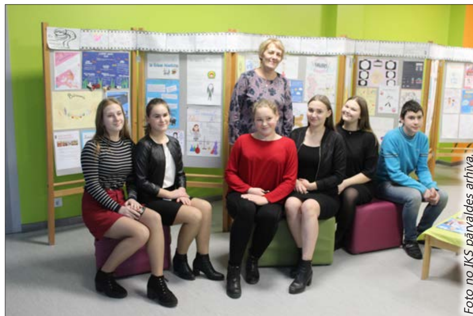
Stacijas skolas audzēkņi aktīvi iesaistījās konkursa norisē.

Aktivitātes tika īstenotas programmas "Izaugsme un nodarbinātība" 8.3.5. specifiskā atbalsta mērķa "Uzlabot pieeju karjeras atbalstam izglītojamajiem vispārējās un profesionālās izglītības iestādēs" projekta Nr. 8.3.5.0/16/I/001 "Karjeras atbalsts vispārējās un profesionālās izglītības iestādēs" ietvaros.