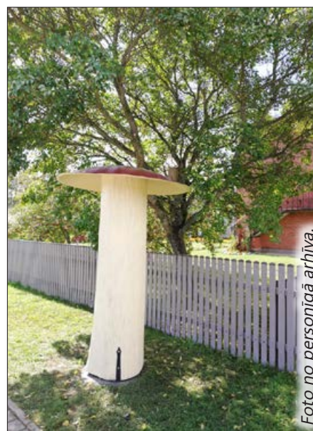
Pie pagasta un Bērzkalnes pirmsskolas izglītības iestādes sētas, vietā, kur skolēni gaida autobusu, tika uzstādīts jauns objekts – sēne, gan skaistumam, gan lietderībai – ja nu lietus!

Viens no tiem ir akas ierīkošana Priedaines kapos, kas tiešām bija ļoti smags darbs. No ieceres līdz rezultātam pagāja divi gadi. Liels gandarījums par saviem pagasta darbiniekiem, kas strādāja un atbalstīja manu ieceri un ieguldīja milzu darbu, par paveikto saņemot manu "Paldies!". Vienkārši apzinājās šīs akas nepieciešamību. Darba