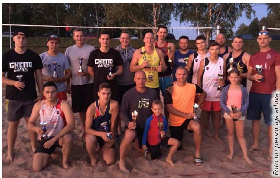
Volejbolisti pēc šī gada čempionāta noslēguma.

Ar pilnīgu vietu sadalījumu varat iepazīties Balvu Sporta centra mājaslapā www.balvusportacentrs.lv .