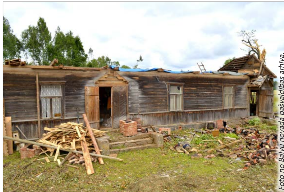
Viena no vētrā cietušajām saimniecībām.

Šādas krīzes situācijas norāda un atgādina, ka iedzīvotājiem ir jābūt atbildīgiem un, ja ir iespēja, jāapdrošina savs mājoklis un saimniecība, jo nekad nevar paredzēt dabas postošo ietekmi.