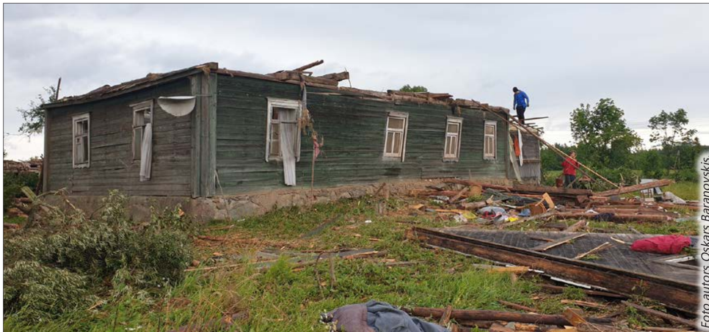
Virpuļviesulis zemnieku saimniecībā "Krašiņi" nopostījis ne tikai dzīvojamo māju, bet arī saimniecības ēkas.

Balvu novadu 6.jūlija pēcpusdienā skāra postošākā dabas stihija pēdējo gadu laikā, kurā virpuļviesulis nodarījis smagus zaudējumus četrām mājāsaimniecībām Bērzpils pagastā. Dzīvojamām mājām norauti jumti ar visām spārēm, bojātas sienas, griestu segums un nogāzti koki. Vissmagāk cietusi bioloģiskā zemnieku saimniecība "Krašiņi", kurā nopostītas pilnībā visas ēkas. Tāpat virpuļviesulis nodarījis lielus postījumus pašvaldības kapsētā un vairākos privātajos mežos.