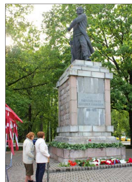
Par Latgales partizānu pulka karavīru varonību un pašaieliedzību mums vienmēr atgādinās piemineklis Latgales partizānu pulka kritušajiem karavīriem.

Pēc tam visiem bija iespēja baudīt svētku koncertu Balvu muižā, kurā muzicēja vīru ansamblis „Dobeles zemessargi”.