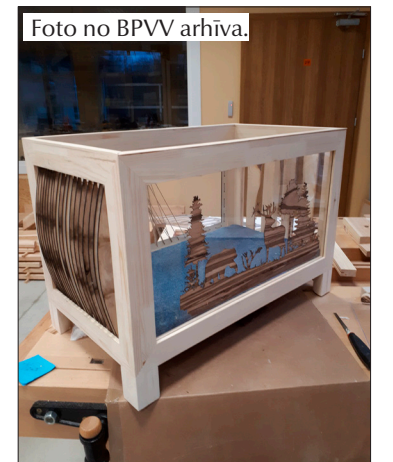
Tehnoloģiju maratonā tapa koka bērnu gultiņa, kas paredzēta bērniem no 4-5 gadu vecumam.