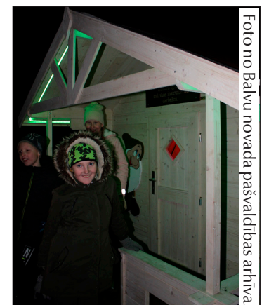
Bērni ar prieku ielūkojās skvēra jaunajās mājiņās.

Lai visiem skaists svētku gaidīšanas laiks!