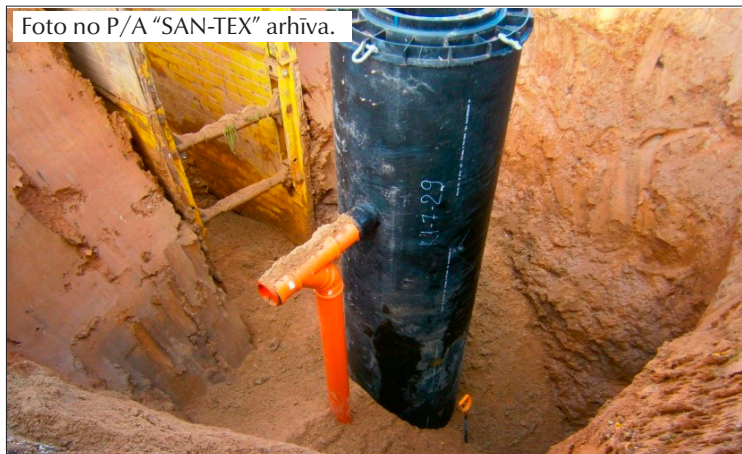
Kanalizācijas skatakas izbūve Celtnieku ielā.