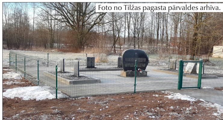
Piemiņas vieta Tilžā.

Tagad šī piemiņas vieta ir ieguvusi pavisam jaunu izskatu.