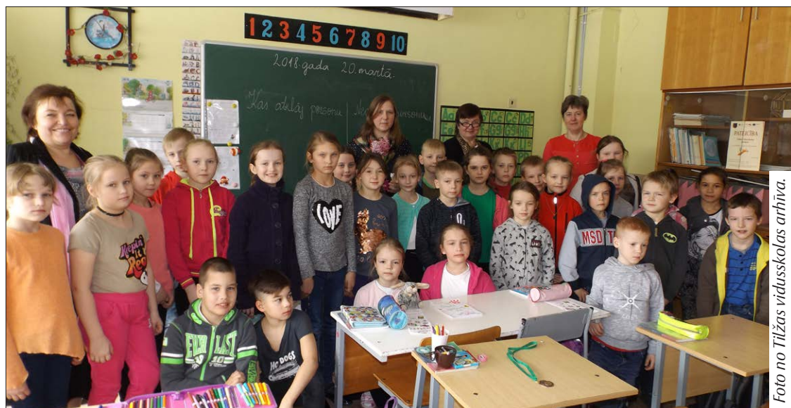
Tilžas vidusskolas jaunākie audzēkņi apguvuši droša interneta lietošanas noteikumus.