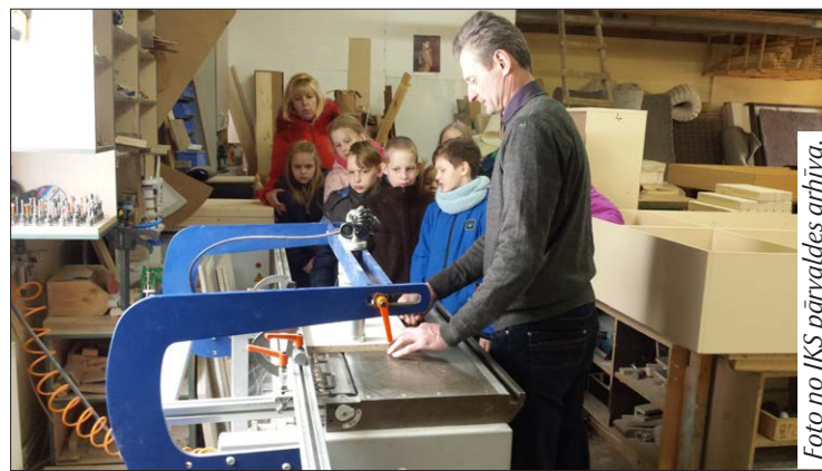
Skolēni tiek iepazīstināti ar mēbeļu gatavošanas procesu.

22. un 29.martā pasākuma "Iekāpjot profesiju korpēs" ietvaros, Stacijas pamatskolas, Stacijas pamatskolas Viksnas filiāles 1.-4.klašu un Tilžas internātpamatskolas 1.-5.klašu skolēni apmeklēja SIA "AMISA", lai iepazītos ar uzņēmēja, mēbeļu ražotāja amatu un praktiski piedalītos profesijas izpētē.