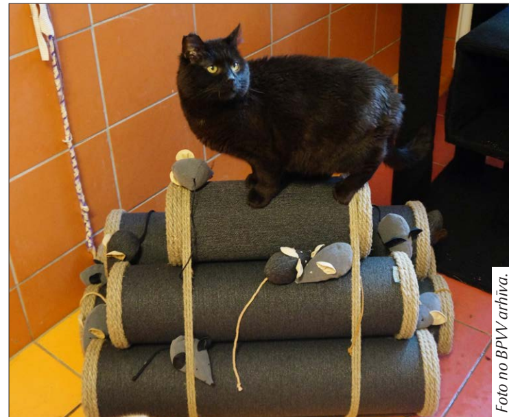
Patversmes kaķis ir priecīgs par jauno rotaļu objektu.