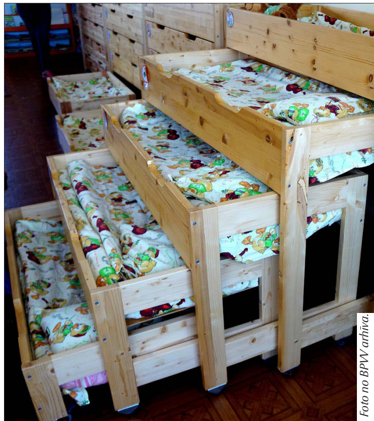
Jaunās PII "Pīlādžītis" gultiņas, kas radītas tepat Balvos!