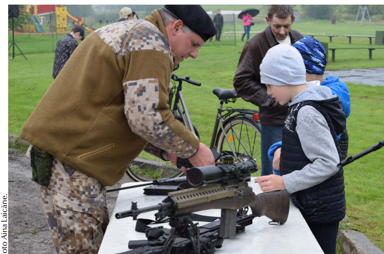
Dalībnieku interesi piesaistīja arī nelielā zemessardzes ieroču izstāde. Tos varēja gan apskatīties, gan paņemt rokās un izpētīt.