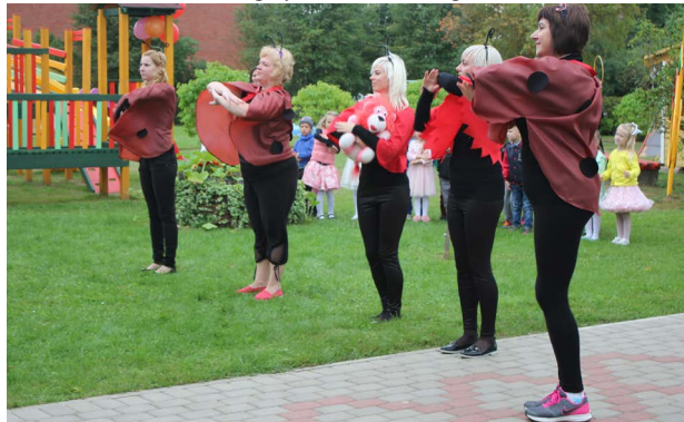
PII "Pīlādzītis" bērnus iepriecināja jautrās bizmārites, kuras aicināja skatīt punktiņus uz saviem spārniņiem, lai noskaidrotu, cik kurai gadu.