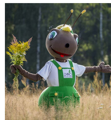
SIA "ZAAO" skudra Urda.

Kā ierasts, ir iespēja piedalīties arī otrreizējo materiālu vākšanas akcijā "Dabai labu darīt". Ikgadēji akcijas "Dabai labu darīt" balvu fondu nodrošina AS "Latvijas Zaļais punkts". Kopumā konkursu dalībnieki saņems balvas par