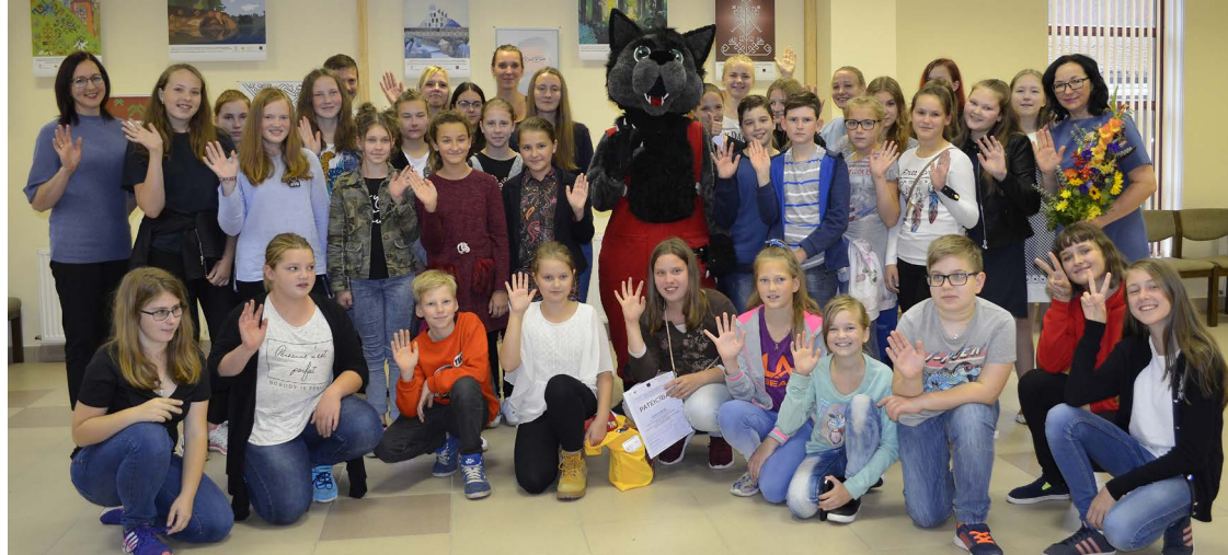
Priecīgi un lepmi par padarīto, - tādi ir konkursa laureāti.