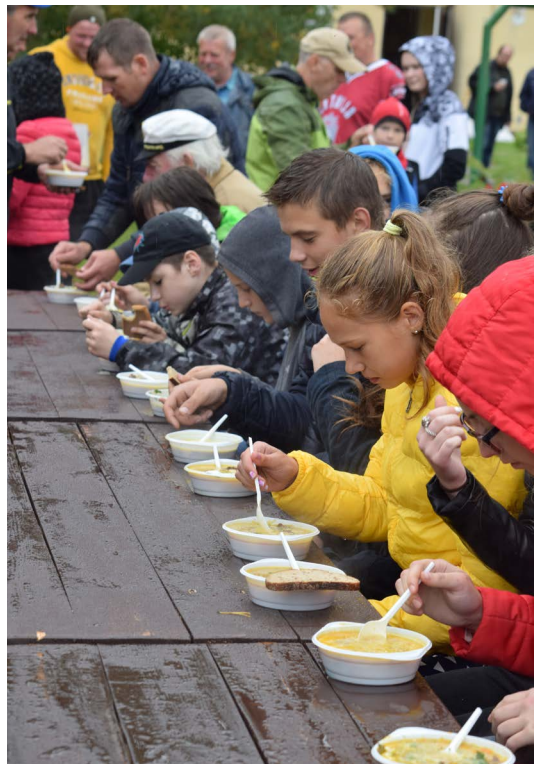
Pēc sportošanas visi iestiprinājās ar zupu, ko gatavoja draugi no Bērzgales pagasta, bet produktus bija sarūpējuši mednieku un makšķernieku kolektīva "Kubuli" pārstāvji.

Dienas beigās gan pasākuma organizatori, gan viesiem bija gandarījums par skaisti un aktīvi aizvadīto dienu.