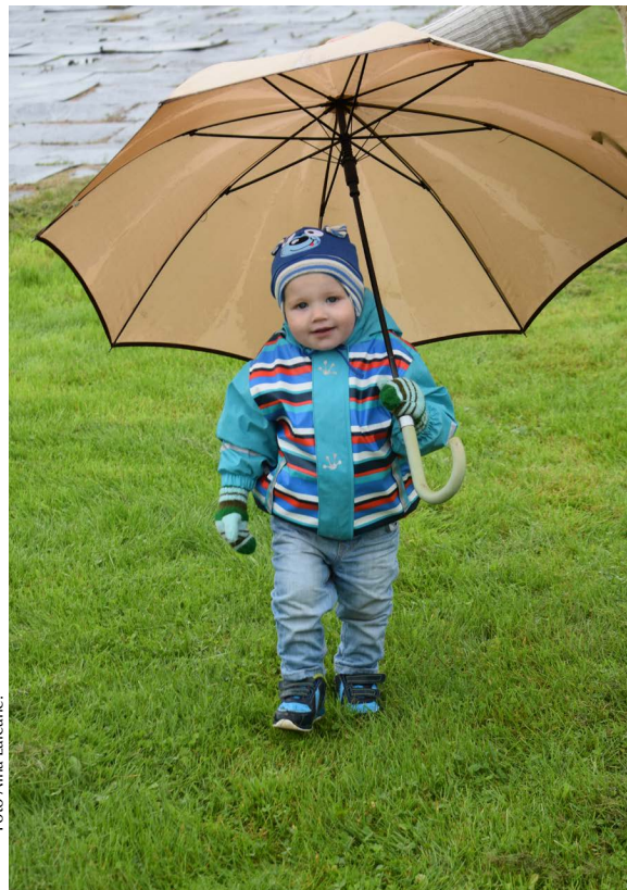
Tas nekas, ka lietus. Kā medz teikt, – nav nepiemērotu laika apstākļu, ir tikai nepiemērots apģērbs.