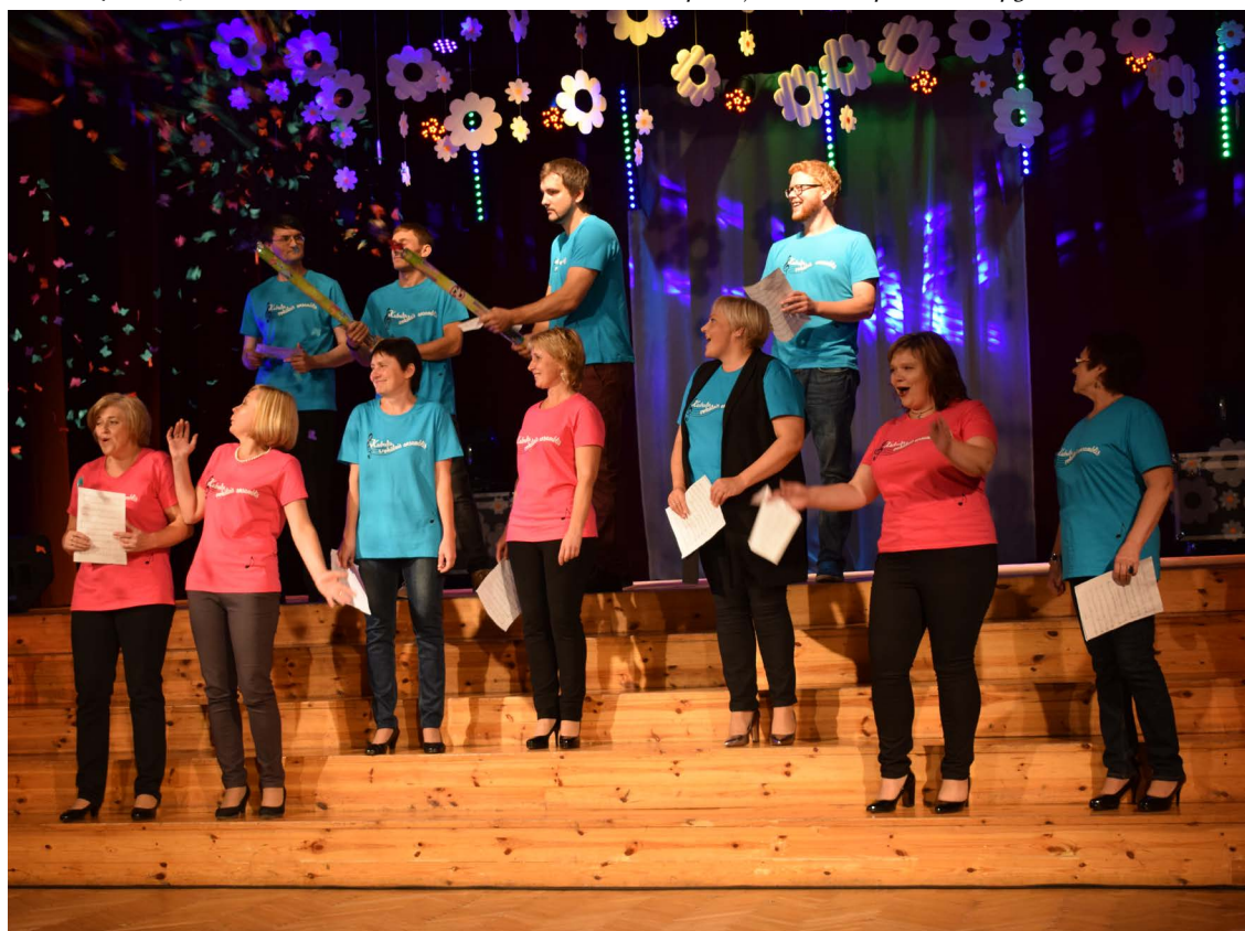
Svētku novakarē publiku priecēja Kubulu vokālais ansamblis.