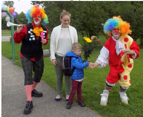
Klauni Čiko un Riko iepriecināja katru, kas nāca pa dārziņa vārtiem – gan lielos, gan mazos.