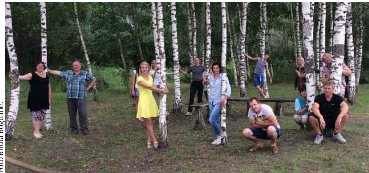
Ekskursanti līcas apmetnes ciemā.