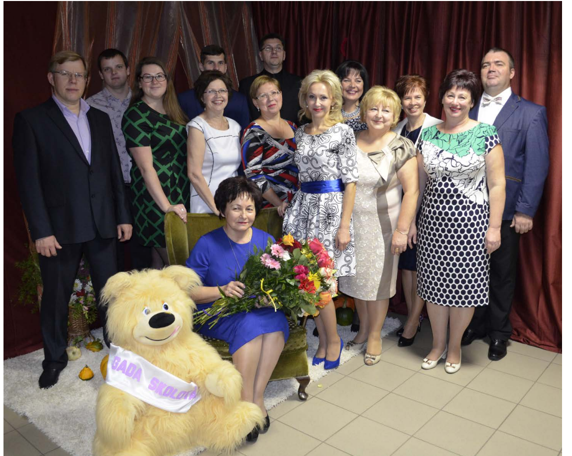
Iespēju iemūžināt mirkli izveidotajā foto stūrītī izmantoja arī Balvu Mūzikas skolas pedagogi.