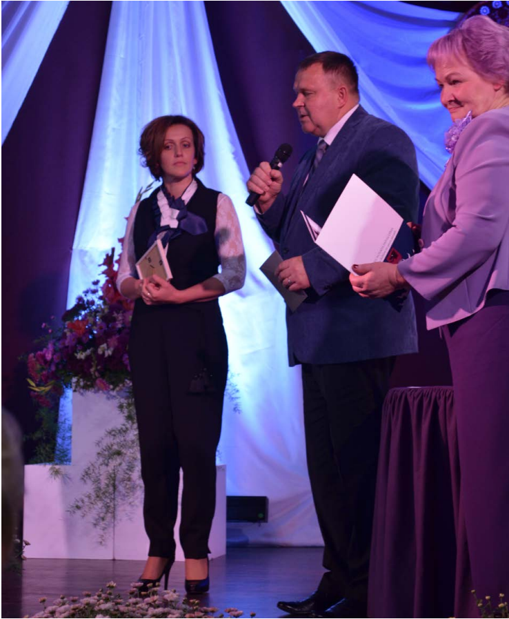
Nominācijā „Par sasniegumiem centralizēto eksāmenu kopvērtējumā” tika izvirzīta un balvu saņēma Balvu Valsts ģimnāzija. Skolā 2015./2016.m.g. centralizētajos eksāmenos vidējais procentuālais novērtējums bija 62,2% (par 12,3% augstāks nekā valsts centralizētajos eksāmenos vidējais procentuālais novērtējums).