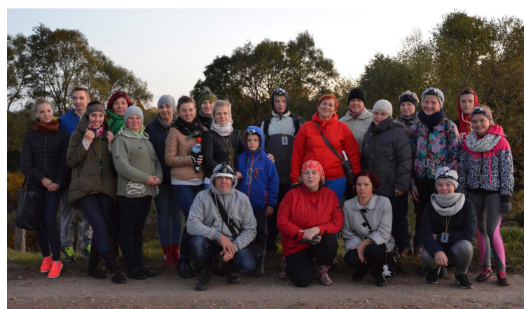
Nakts pārgājiena dalībnieki.