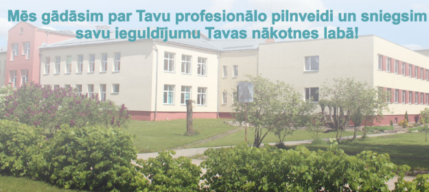
Mēs gādāsim par Tavu profesionālo pilnveidi un sniegsim savu ieguldījumu Tavas nākotnes labā!

Uzzini par mums vairāk interneta vietnē – www.bpvv.lv un mūsu www.facebook.com/bamatniekuvsl/ profilā –