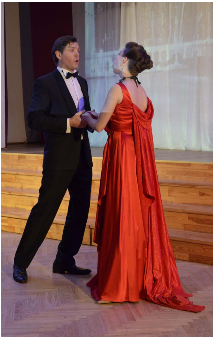
Duets. Gan draiskās, gan liriskās, gan komiskās krāsās priekšnesumus svētkos sniedza „Op-E-Re-Te” mākslinieki.