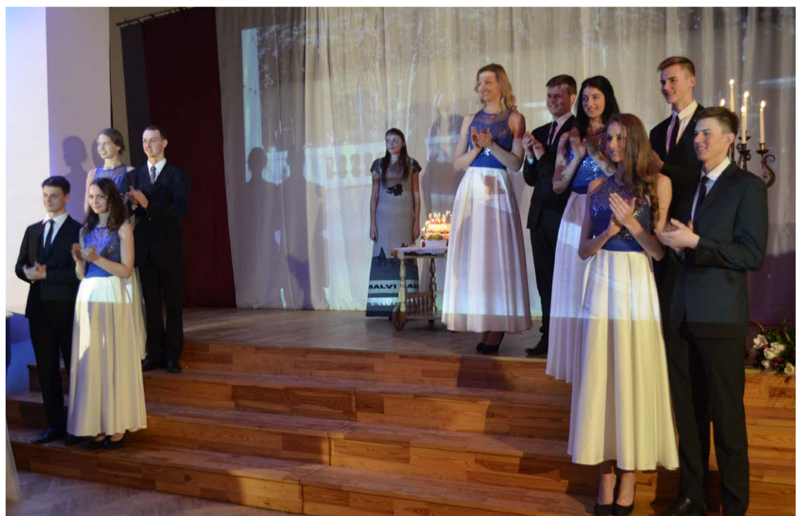
Svētku noslēgums. Pēc koncerta, kā jau dzimšanas dienās pienākas, muižas zālē svinīgi tika ieviesta svētku torte. Noslēgumā „Mīs un Mistērs Balvi” dalībnieki sniedza emocionālu priekšnesumu valša ritmos.