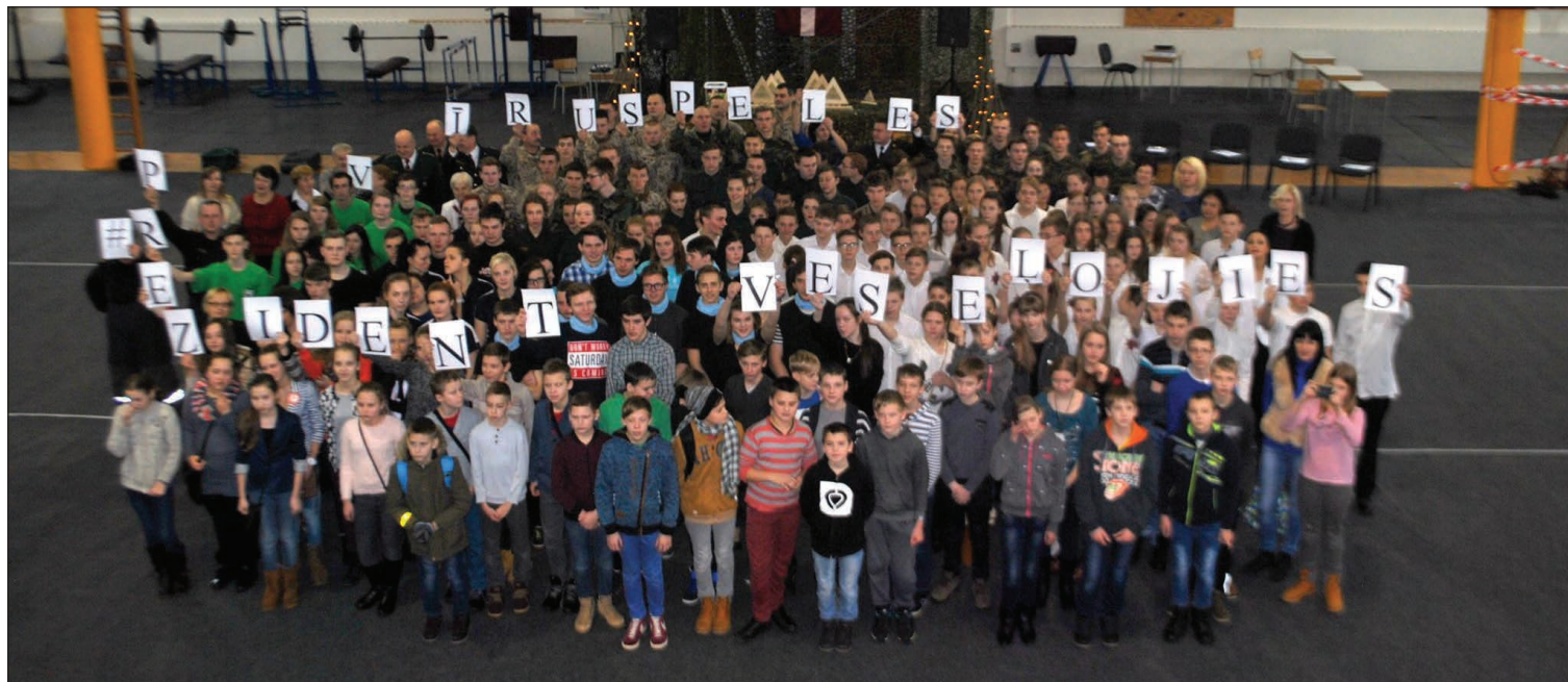
Pasākuma „Vīru spēles” sākums šogad bija neierasts, jo visi klātesošie vienotās zibakcijā „PrezidentVeselojies”, tā izsakot savu atbalstu mūsu Valsts prezidentam

Pasākumu bagātināja AMI Zemessardzes 31. AMII pulka vīri, piedāvājot komandām