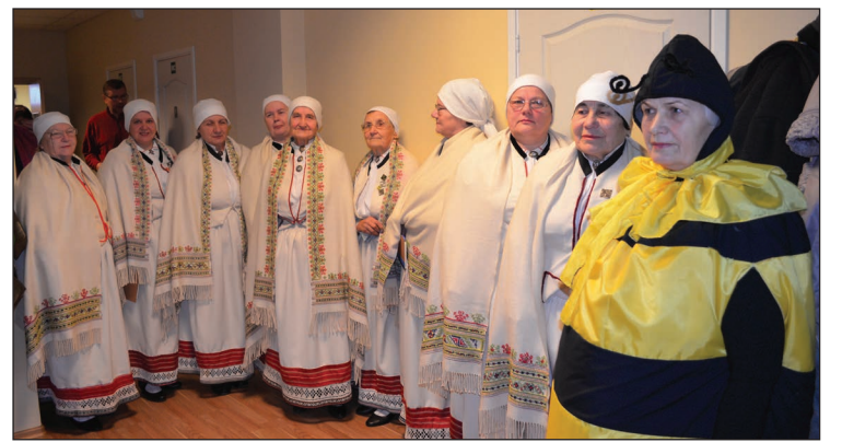
Konferences dalībniekus priecēja ne tikai etnogrāfiskais ansamblis „Abrenīte”, bet arī uz konferenci atlidojusī bite