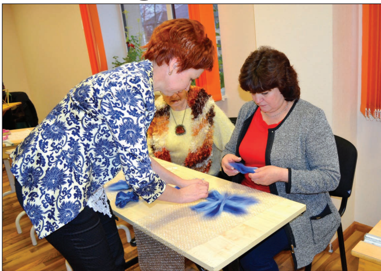
Konferences noslēgumā sievietes aktīvi darbojās radošajās meistardarbnīcās

Aizvadītā gada 18.decembrī notika 8. Lauku sieviešu konference „Sieviete – uzņēmēja laukos”, kuru organizēja Ziemeļlatgales Biznesa un tūrisma centrs kopā ar biedrību „Rudzupuķe”.