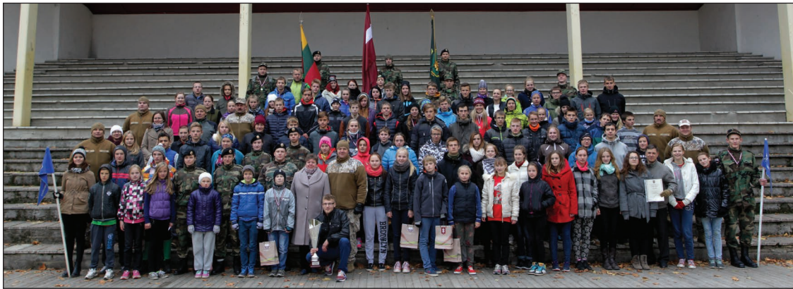
“Vējiņu kausa” dalībnieki.

Sestdien, 10. oktobrī Balvos notika Rekrutēšanas un Jaunsardzes centra (RJC) rīkotās jaunsargu orientēšanās sacensības “Vējiņu kaus”. Sacensībās piedalījās 110 Latvijas jaunsargi un 12 viesi no Lietuvas un Igaunijas. Sešās vecuma un dzimuma kategorijās visas godalgotās vietas zēniem saņēma Latvijas pārstāvji. Savukārt meitenēm lielu daļu balvu ieguva latvietes, bet 2. un 3. vietu katra savā vecuma kategorijā saņēma divas igauņietes. Lietuvieši šoreiz sevi nepierādīja starp labākajiem. Visvairāk godalgotās vietas – astoņas – izcīnīja 2. jaunsargu novads, iegūstot ceļojošo kausu un sacensību lielo balvu – telti.