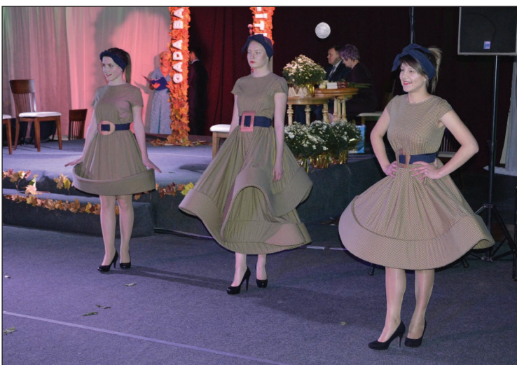
Pasākuma laikā Balvu Profesionālās un vispārīzglītojošās vidusskolas audzēknes demonstrēja tērpu kolekcijas.