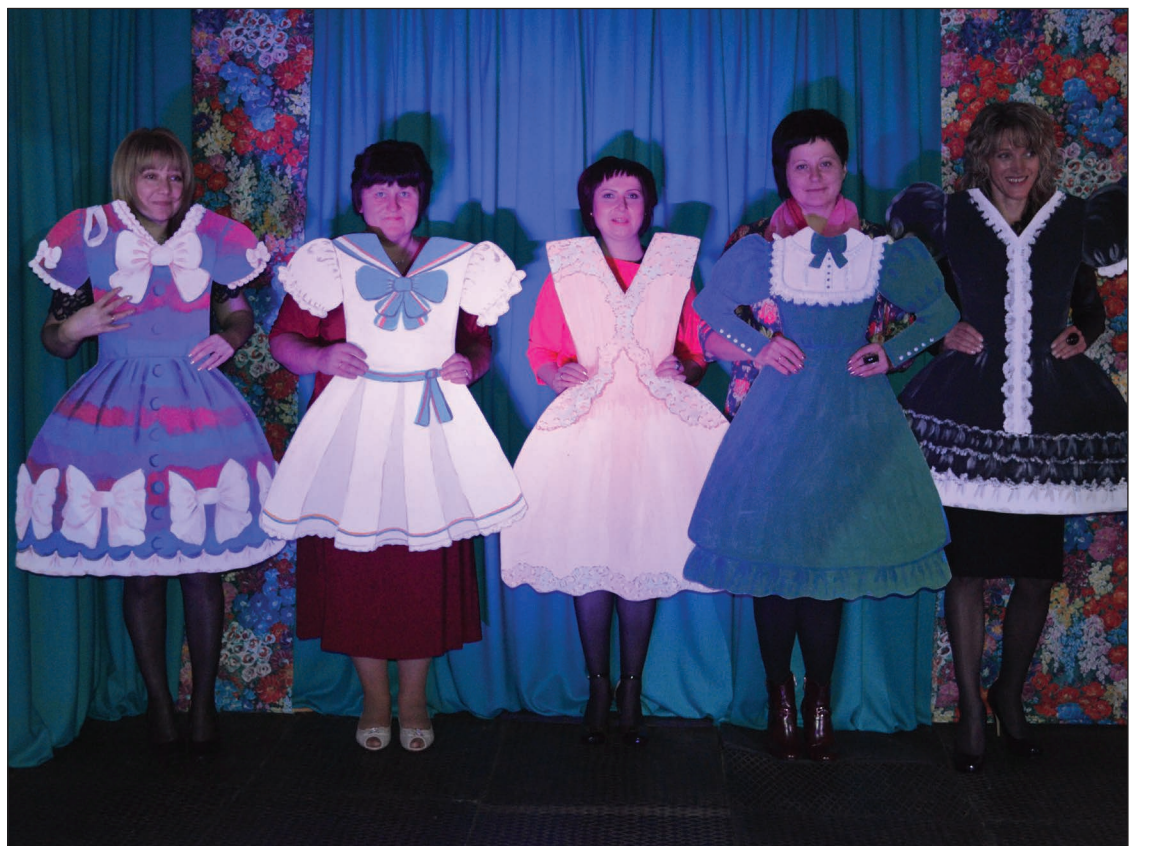
Lai ikviens varētu iemūžināt svētku mirkļus, Balvu Profesionālās un vispārīzglītojošās vidusskolas kolektīvs bija izveidojis divus foto stūrīšus, kurus izmantoja arī Tilžas internātpamatskolas skolotājas.