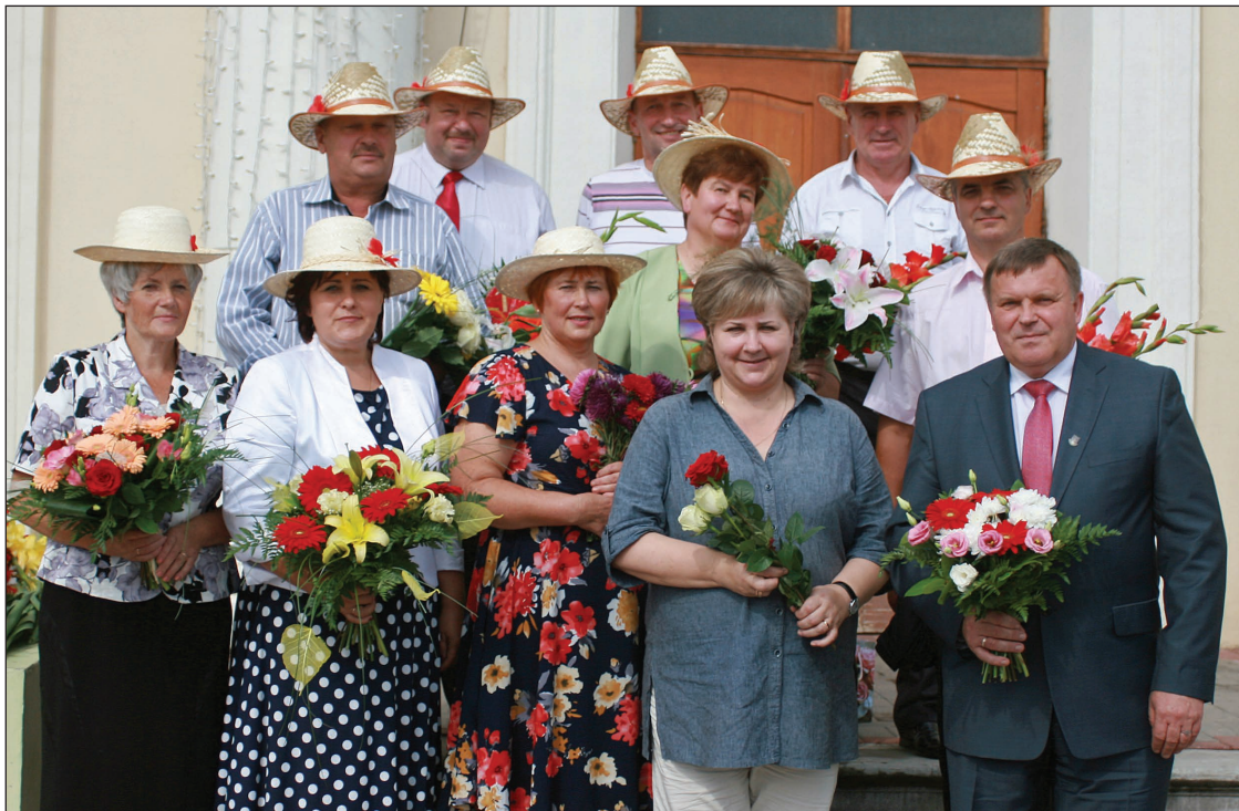
Pasākumā „Lauki iebruc pilsētā” pie Balvu Kultūras un atpūtas centra tika uzgavilēti tiem cilvēkiem, bez kuriem novads nevarētu pastāvēt – Balvu novada vadībai un novada pagastu pārvalžu vadītājiem

Vakara noslēguma koncertā ar skaistām dejām un dziesmām priecēja kolektīvi no Balvu novada pašvaldības sadarbības pašvaldībām Igaunijā, Lietuvā un Baltkrievijā, kā arī atraktīvais Valmieras Drāmas teātra dziedāšo aktieru ansamblis „Žerāri”.