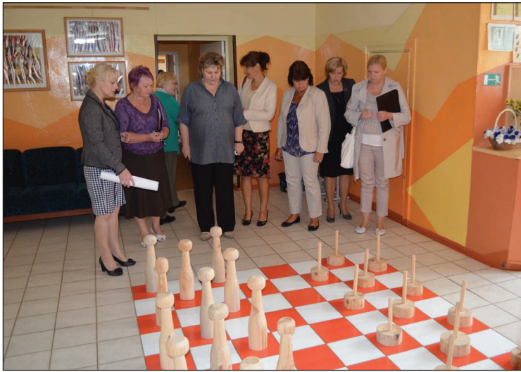
Komisija ar sajūsmu pēta Briēžuciema pamatskolā izveidoto šaha laukumu