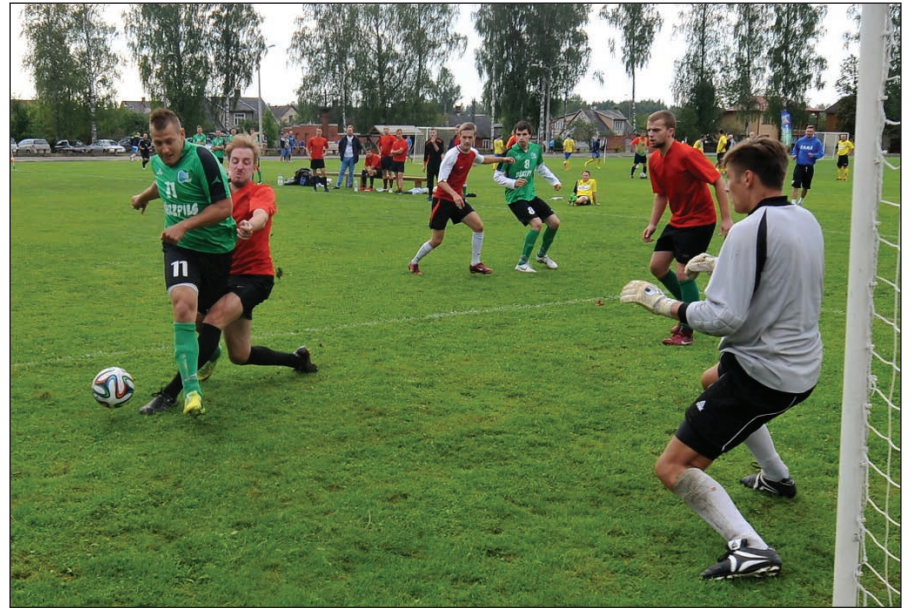
Par uzvaru spēlē cīnās „Zidāni no Brazīlijas” un FK Bērzs BSC, kuri čempionāta posmā kopvērtējumā izcīnīja 8.vietu