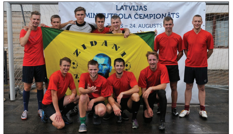
Diemžēl Balvu komandai „Zidāni no Brazīlijas” zīmīgais nosaukums tomēr nenesa gaidīto veiksmi un minifutbola čempionāta posmā komanda ieguva 13.vietu

Latvijas Minifutbola čempionāts MĪTAVA OPEN 2014 tiek rīkots ar mērķi veicināt sportisku brīvā laika pavadīšanu un noskaidrot spēcīgāko minifutbola komandu Latvijā.