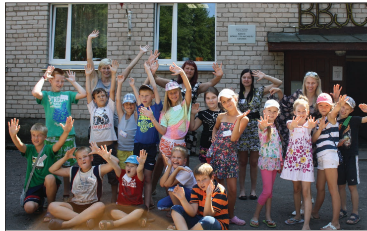
Nometnes dalībnieki ar tās organizatoriem un nodarbību vadītājiem

Balvu Bērnu un jauniešu centrā (BBJC) 4.augustā durvis vaļā nometnei „Durvis vaļā” atvēra 20 bērni vecumā no 7-12 gadiem.