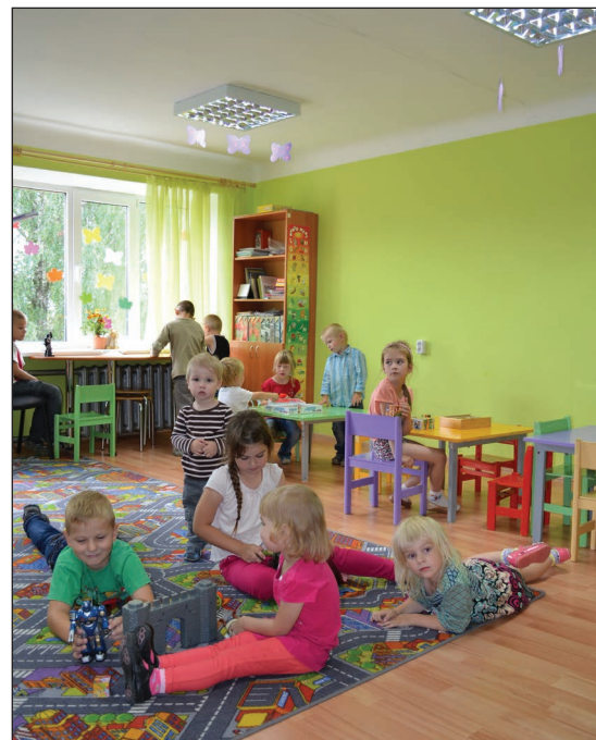
Bērzpils pagasta bērnudārza grupiņa