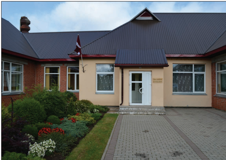
Tilžas vidusskolas Vectilžas filiāle jauno mācību gadu uzsāks zem jauna jumta