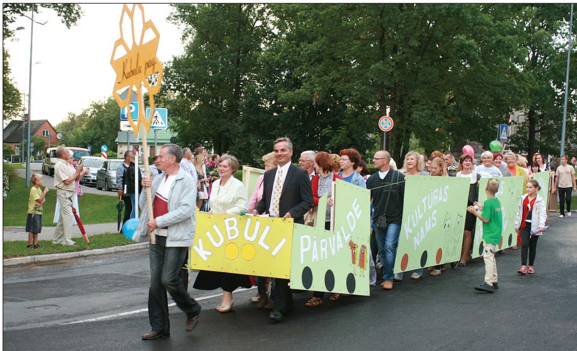
Šogad neizpalika arī krāšņais svētku gājieni, kurā ar krāsainiem tērpiem, baloniem, ziediem un citiem noformējumiem piedalījās pagastu pārvalžu kolektīvi, pašvaldības iestādes un novada uzņēmumi. Gājienā piedalījās arī Kubulu pagasta vilciens ar vairākiem sastāviem, kurš pēc žūrijas vērtējuma ieguva pirmo vietu