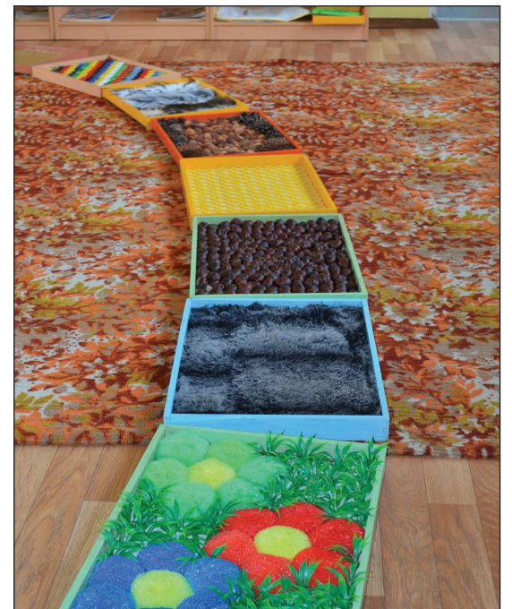
Bērzkalnes pirmsskolas izglītības iestādē izveidota sava Baskāju taka