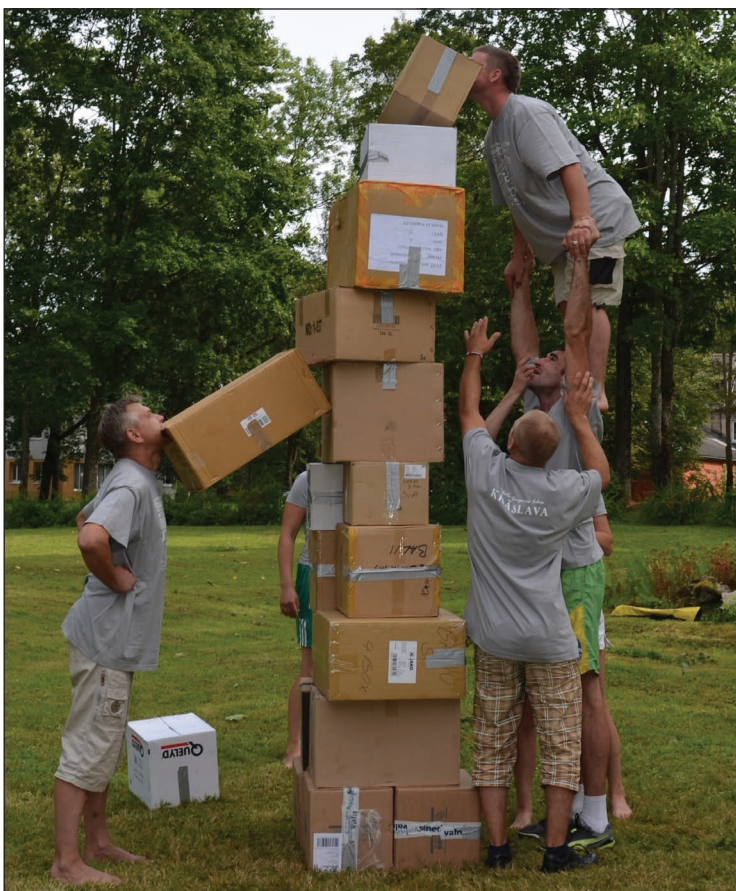
Krāslavas komanda stafetē „Torņa celšana”

Latvijas piļu un muižu „Muižnieku turnīru” organizēja Balvu novada pašvaldība sadarbībā ar Balvu muižas, Balvu Sporta centra, Balvu Sporta skolas kolektīvu un Latvijas Piļu un muižu asociāciju.