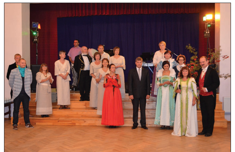
Apbalvošanas ceremonijā ar dejām, krāšņiem tērpiem un gardiem ēdieniem skatītājus pārsteidza gan dejotājas, gan pavāri, gan „Muižnieku turnīra” organizatori