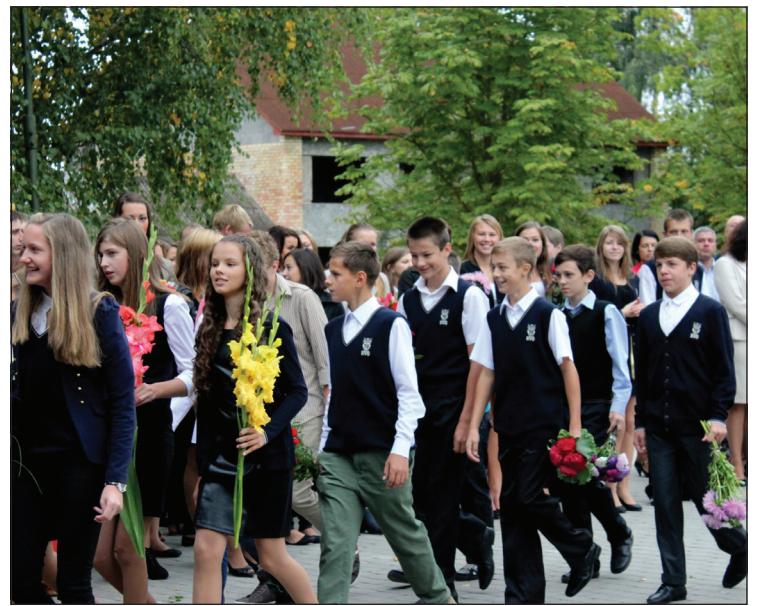
svārkus u.c. apģērba elementus, padome”, uzskata ģimnāzijas direktore. bet par to lai lemj paši skolēni, vecāki, pašpārvalde un ģimnāzijas

„Lai arī vairākumā Latvijas skolu tiek praktizēta viena apģērba elementa nēsāšana, tomēr skolēniem un vecākiem būtu jāpiedāvā iespēja iegādāties arī