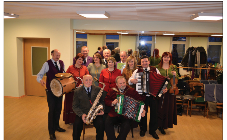
Kapella “Dvaras” no Lietuvas