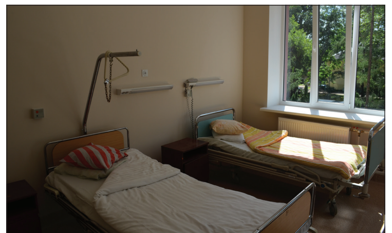
Vienā no izremontētajām palātām