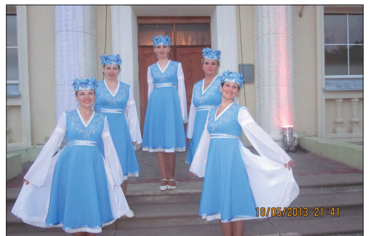
Ansamblis „Vjarba” no Baltkrievijas