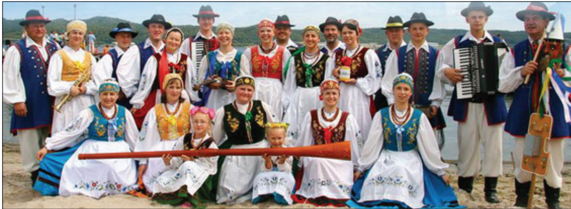
Ansamblis “Bazuny” no Polijas