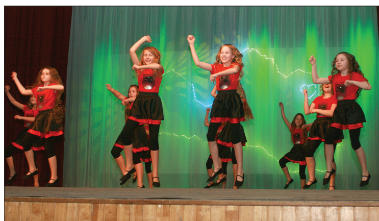
Mūsdienu deju grupa "Lulū"