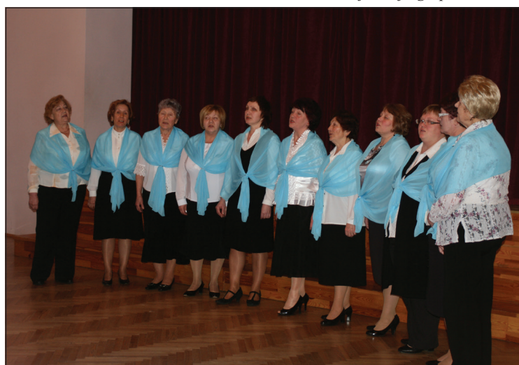
Biedrības Razdolje ansamblis