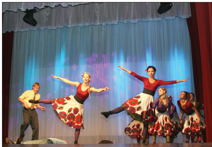
Uzstājas deju grupa "Buras"

„Es mīlu savu pilsētu” – svinīgā sarīkojuma izskaņā kopīgi skandēja visi sarīkojuma dalībnieki.