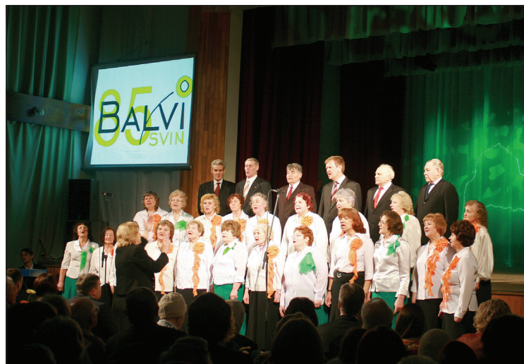
Uzstājas senioru koris "Pīlāzis"