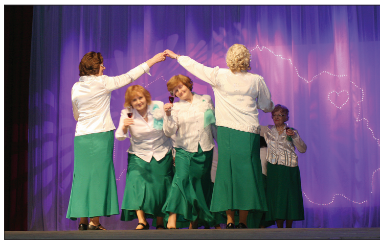
Dejo Eiropas deju kopas "Atvasara" dalībnieces