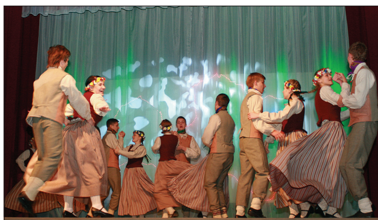
Deju kopa "Rika"