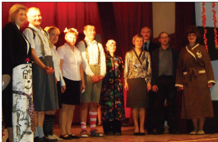
„Sipiņi” pēš sava priekšnesuma par skolas dzīvi

9. novembrī, Mārtiņdienas un Lāčplēša dienas priekšvakarā, Briežuciema dramatiskais kolektīvs „Sipiņi” svinēja sava kolektīva 10. dzimšanas dienu.