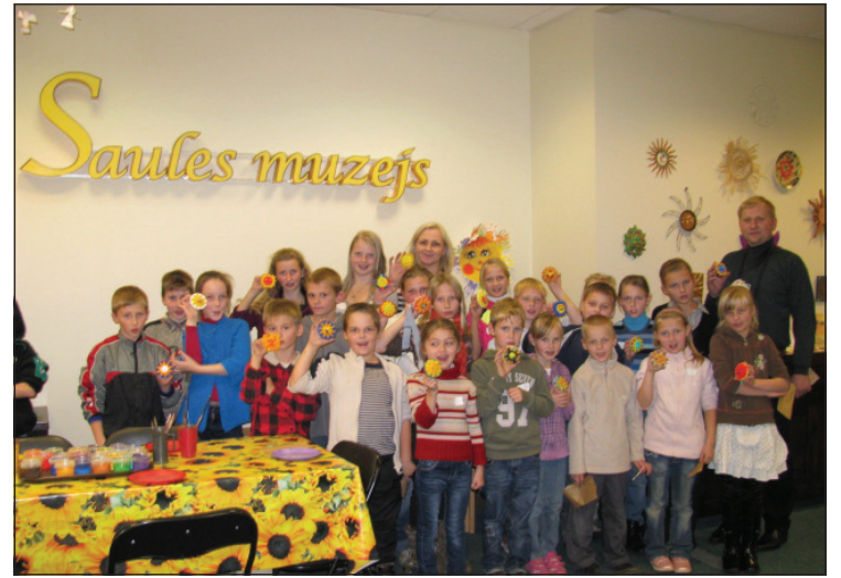
Ekskursanti Saules muzejā

Balvu novada pašvaldības Sociālais dienests, sadarbībā ar Biedrību „Ascendum”, saņēma atbalstu projekta „Garā pupa” realizēšanai. Projekta ietvaros bija paredzēta arī ekskursija uz Rīgu 25 trūcīgo ģimeņu bērniem vecumā no 6 līdz 12 gadiem.