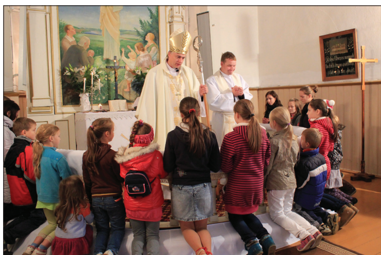
Svētdienas dievkalpojums Balvu evaņģēliski luteriskajā baznīcā bija īpašs, jo šajā dienā tika atzīmēta draudzes 110 gadu jubileja un pļaujas svētki. Šiem notikumiem par godu