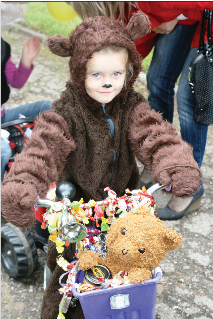
Kur nu bez lāčiem Balvu dienās Lāča dārzā.