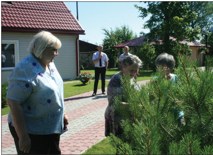
Vērtēšanas komisija dārzus izpētīja pamatīgi

Balvu novada svētku ietvaros 24. un 25.jūlijā tika vērtēti Balvu novada sakoptākie ģipšumi.