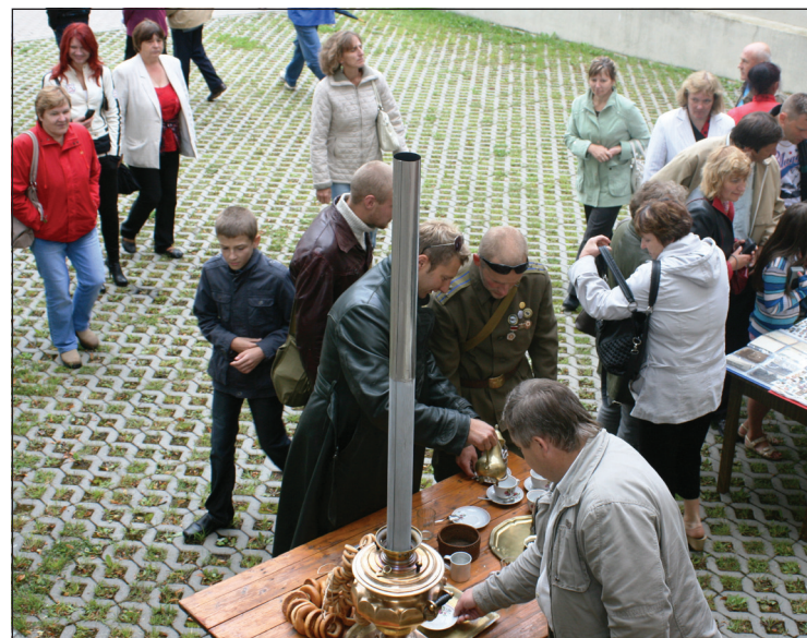
Pie Balvu novada muzeja pulcējās ļaudis, lai iegādātos kādu senlietu, kā arī dažādus koka izstrādājumus, ēdienus un dzērienus.