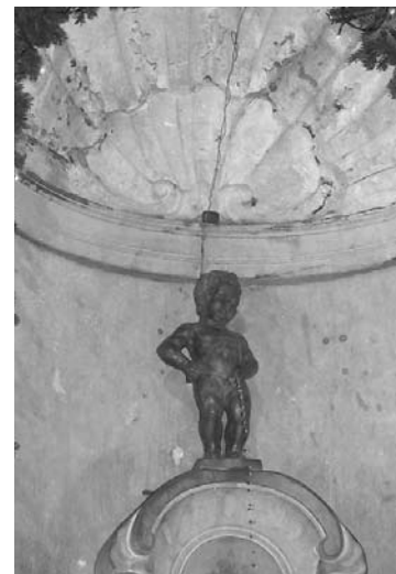
Briseles simbols „Čurājošais puisītis”

Greznajā, tikko atrestaurētajā, divu svēto Briseles patronu Sv. Miķeļa un Sv. Gudulas vārdā nosauktajā katedrālē,