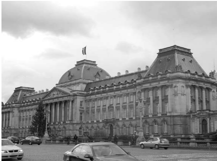
Karaļa Alberta II darba vieta

ir īpatnēja struktūra, kvartāli nav regulāri, tā, ejot vienā virzienā, var nonākt pavisam citā malā, nekā bija domāts. Ar mums tā arī notika – vēlēdamies nonākt Grand Place laukumā, attapāmies pie Tiesu pils pavisam citā Briseles pusē. Bet, ja karte ir rokā un mēle mutē, tad jebkura situācija ir labojama.