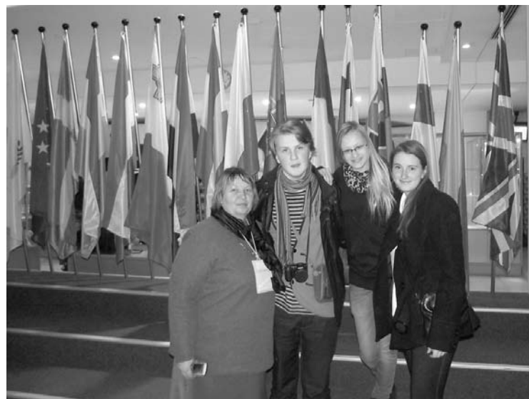
Balvu Valsts ģimnāzijas grupa Eiropas Parlamentā

Briseles centra skaistāko daļu veido vecpilsēta un karaliskais kvartāls. Brisele dibināta 580.gadā. Broeksele - nozīmē „ciemats uz purva”. 14.gadsimtā tika uzceltas otrā līmeņa pilsētas sienas, tā pilsētai radās piecstūra forma, kāda ir arī tagad. Briseles vecpilsētas ieliņu izvietojumam