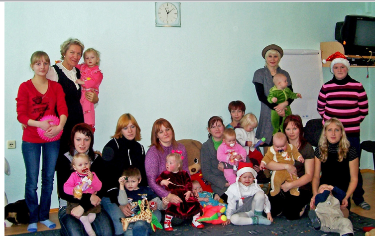
Māmiņu skolā. Sociālajā dienestā jaunās māmiņas var saņemt zinošu speciālistu konsultācijas un savā starpā pārrunāt interesējošos jautājumus.

Atbalsta un rehabilitācijas nodaļā uz 2011.gada 1.janvāri uzskaitē bija 178 ģimenes ar bērniem. No tām, 71 ģimene klasificētas kā „aktīvā lieta”, ar kurām sociālais darbs notiek regulāri. Trīsdesmit viena no šīm ģimenēm dzīvo novada pagastos, bet pārējās - Balvu pilsētā. Šī darba veikšanai nodaļā piesaistīti nepieciešamie speciālisti: psihologs, sociālais pedagogs, psihoterapeits, sociālais rehabilitētājs un nepieciešamības gadījumā arī citi speciālisti. Vēl nopietnāks darbs notiek ar 24 augsta riska ģimenēm, kurās uzraudzība tiek