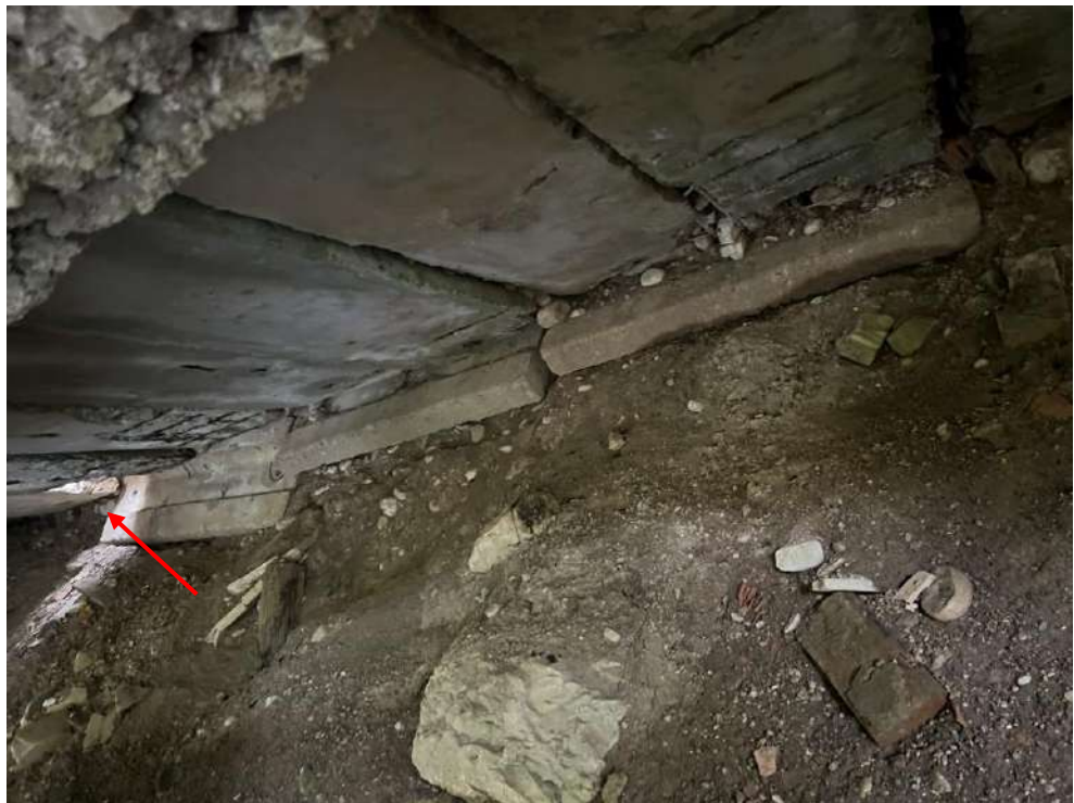
4.att. Izskalojums uzbērumā zem krasta balsta, caurums brauktvē. Skats uz krasta balstu Nr.1.