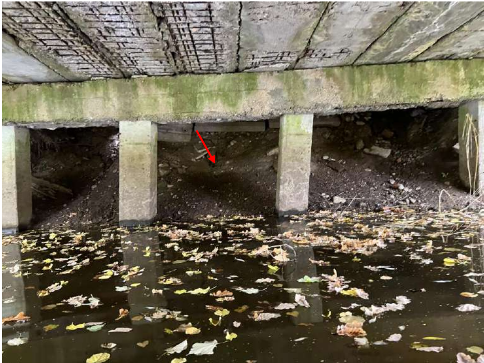
3.att. Izskalojums uzbērumā zem krasta balsta. Skats uz krasta balstu Nr.1.