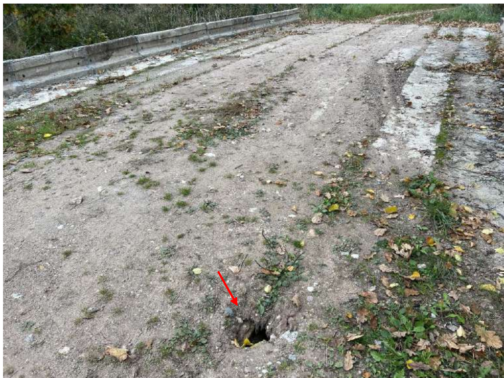
2.att. Iebrukums brauktuves segumā. Skats uz tiltu no augšas.