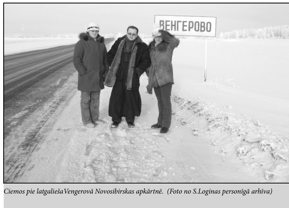
Ciemos pie latgalieša Vengerovā Novosibirskas apkārtnē.

psalmi, un vēl dažādi apzīmējumi tām tiek piešķirti, tomēr īstajā vārdā būtu jāsauc - mirušo ofīcijs, kam latīņu valodā ir oriģinālnosaukums Officium defunctorum un angļu Office of the Dead , būtu tikai latviskojums. Katoļu baznīcā ir divi galvenie