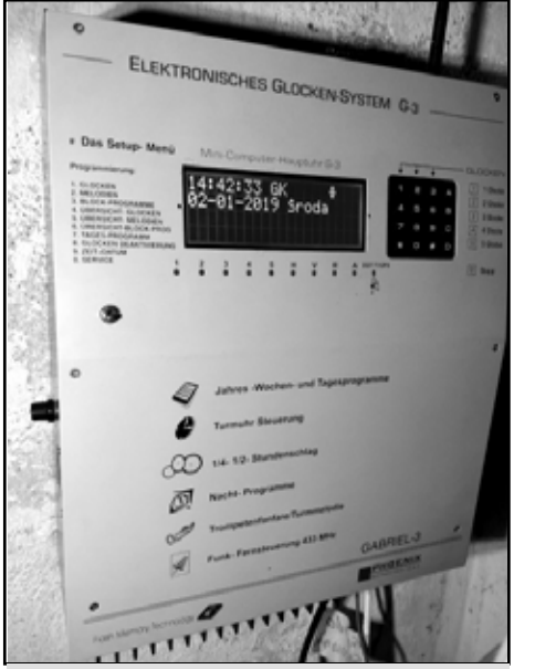
Jaunie digitālie zvani, kuri spēj atskaņot līdz 150 melodijām.

2018.gadā - Latvijas jubilejas gadā Baltinavas RK draudzes dievnama zvans svinēja savu 90.dzimšanas dienu. Zvanam ir bijis dots skaists vārds- Enģeļu Karaliene. Ceturtajā adventa svētdienā visiem klātesošajiem bija iespēja piedalīties jauno digitālo zvani iesvētīšanas ceremonijā un noklausīties pirmo koncertu. 4 skaļruņi tika atvesti no Polijas, saslēgti ar vadības centru un spēj atskaņot apmēram 150 melodijas. Skanēja gan zvanu, gan tauru mūzika. Un tas vēl nebija viss. Baltinavieši un ciemiņi nu savus pulksteņus var pārbaudīt pēc zvana, jo tas ieskandina katru ceturksni, bet pilnās stundas var uzz-