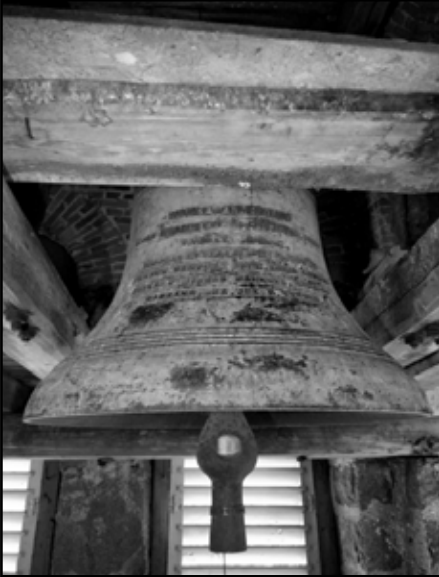
Baltinavas Romas katoļu baznīcas zvanam jeb Enģeļu Karalienei 2018.gadā apritēja 90 gadi.

ināt, skaitot līdzī visus zvana sitienus. Ir ieprogrammēts, ka šī sistēma darbojas katru dienu no plkst.7.45 līdz 20.00. Jebkurā laikā var ieslēgt šo zvanu un tauru skaņas, tāpēc jau laicīgi tiek domāts par baznīcas apkārtnes sakārtošanu un pilnveidošanu, lai klausītāji varētu atrasties dievnama tuvumā un baudīt mūziku. 18. janvārī pie mums notika Lūgšanu brokastis ar mērķi: Bērnu un ģimeņu vietas labiekārtošana pie Baltinavas RK baznīcas. Savāktie līdzekļi tiks izmantoti šī mērķa īstenošanai.