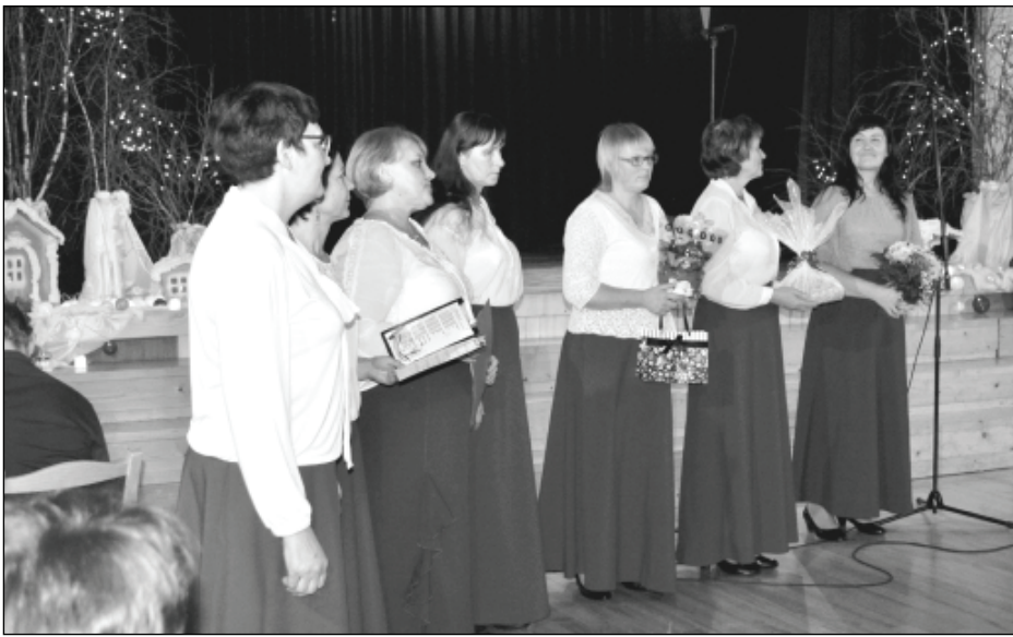
Skaniņas balsis, mirkļus un dziesmas, kuras dāmas laimīgas dara, vēlēja tuvākie kaimiņi - Bērzpils pagasta sieviešu vokālais ansamblis "Naktsvijole".