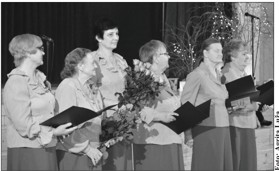
Ar dziesmotu sveicienu uz pasākumu bija ieradušās arī dziedātājas no Kubulu pagasta.