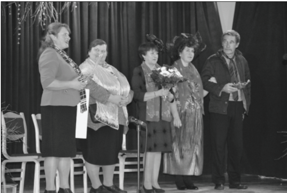
Sveikt ansambli 30 gadu jubilejā, bija ieradušies dalībnieki no Rogovkas amatierteātra.