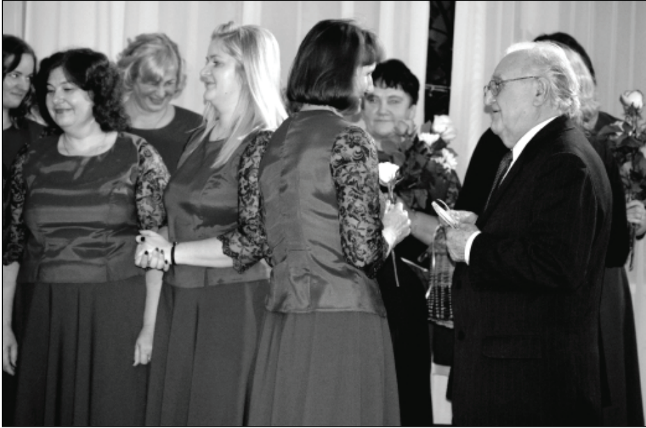
Vēl vismaz 50 dziesmotus gadus dāmu vokālajam ansamblim vēlēja Rugāju jauktais koris.