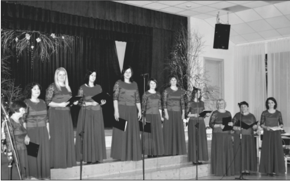
Rugāju tautas nama vokālā ansambļa jubilejas pasākums pulcēja gan tuvākus, gan tālākus ciemiņus.