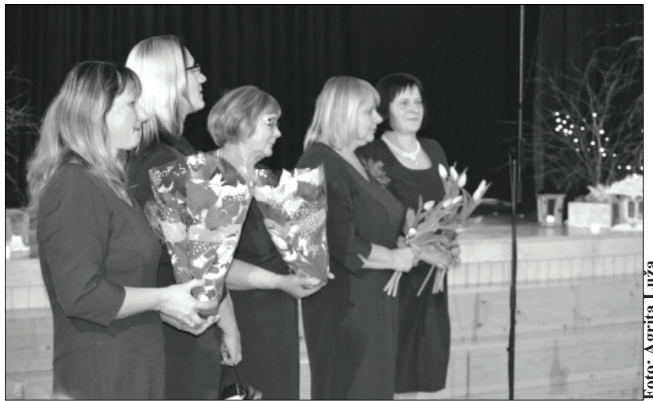
Uz pasākumu ar sveicieniem bija ieradušies ansambļa iemantotie dziesmu draugi, tostarp arī dziedātājas no Rankas.