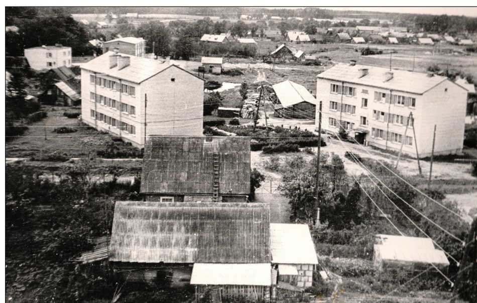
Dzīvojamās mājas Rugāju ciemā (Skolas iela) 60. gados.