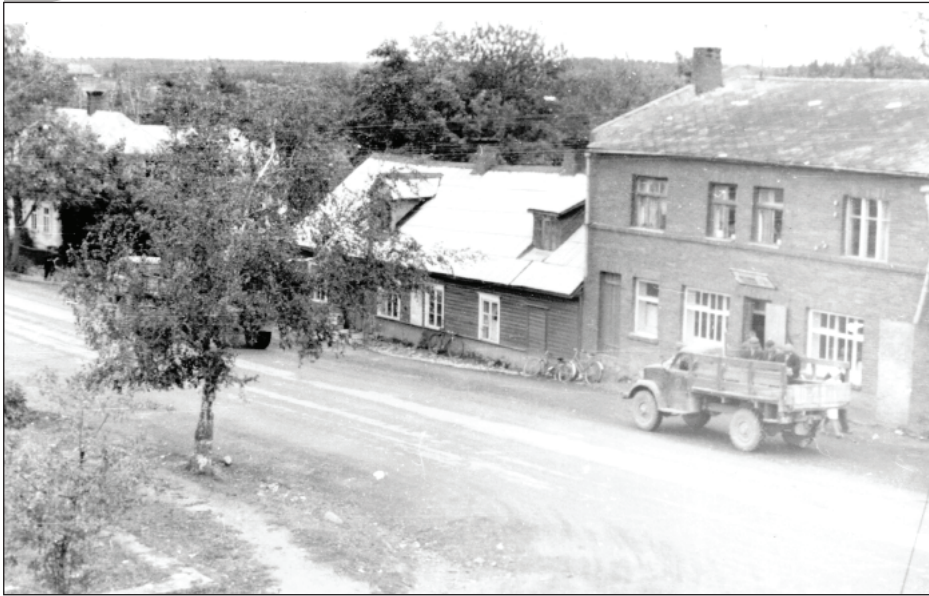
Rugāju centrs 70. gadu beigās. 80. gadi.