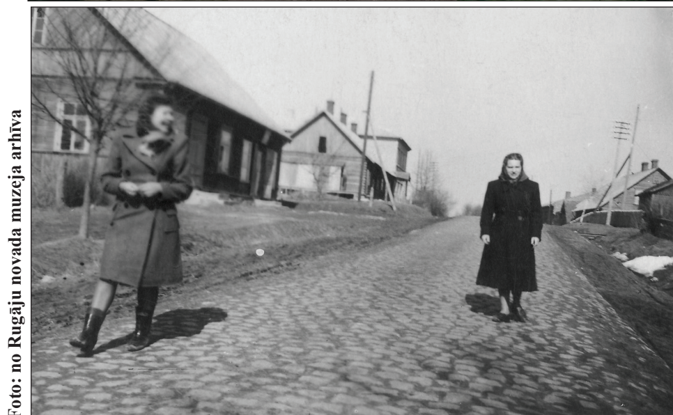
60. gadu sākums. Kurmenes iela bruģēta, pirms asfaltēšanas.