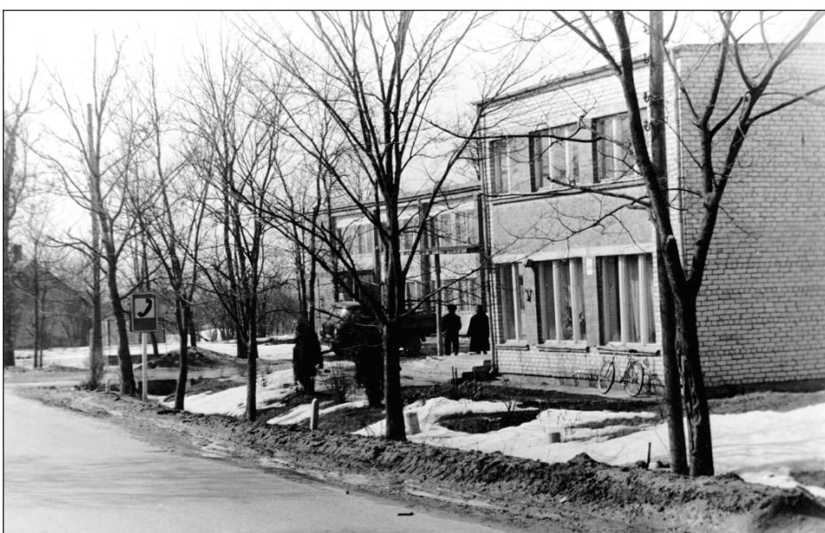
Pasts un kantoris 80. gadu sākumā.