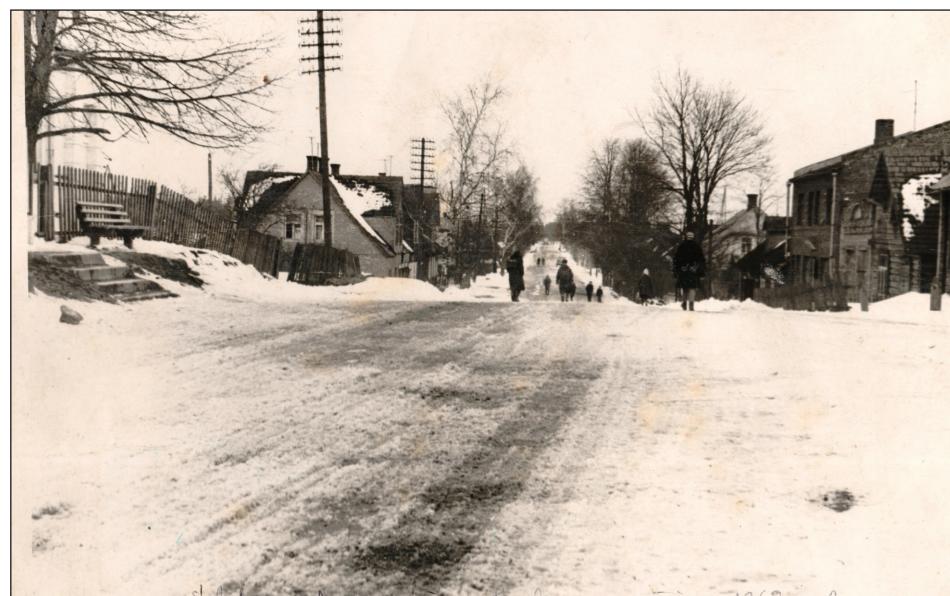
Kurmenes iela Rugāju ciemā 1963. gadā.