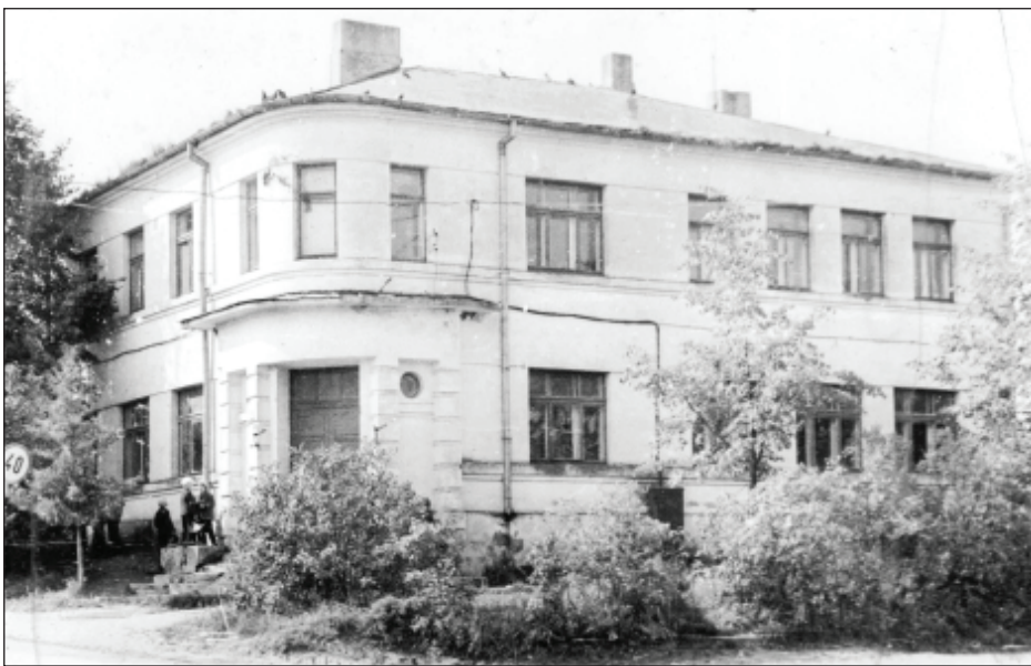
80. gadi, Kurmenes iela 36. Tajā laikā tur atradās Mazā skola.