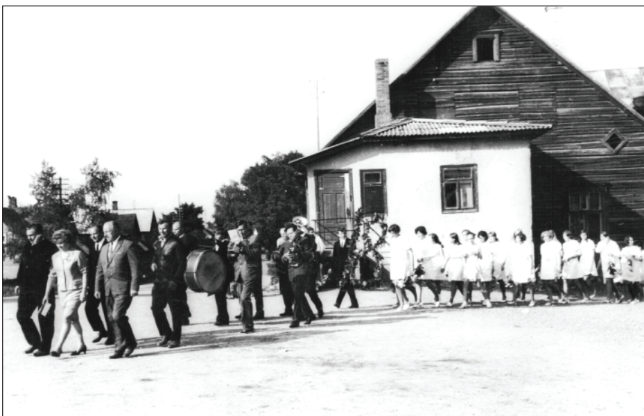
Rugāju klubs 70. gados, no tā iznāk Pilngadības svētku gājiens.