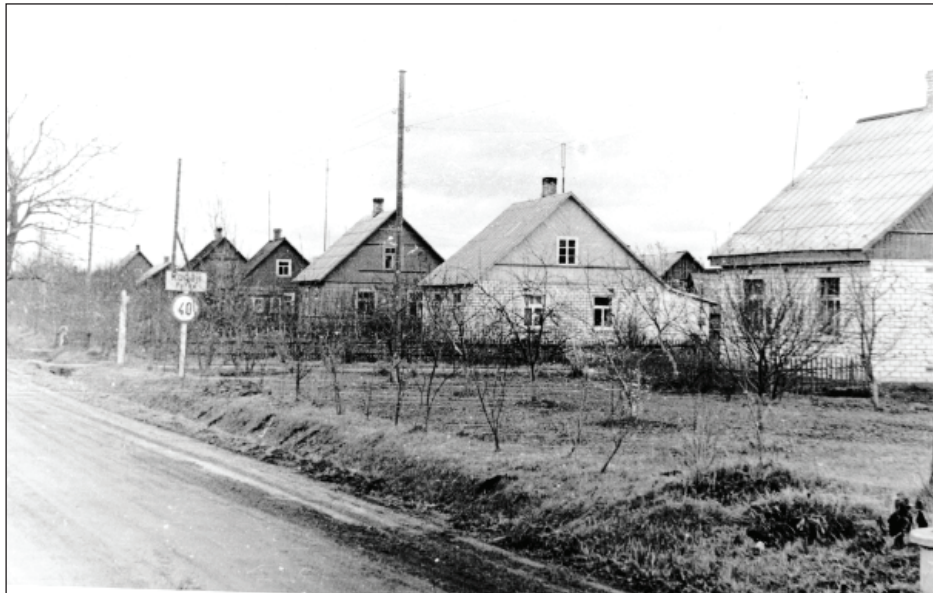
Lubānas iela 80. gados.