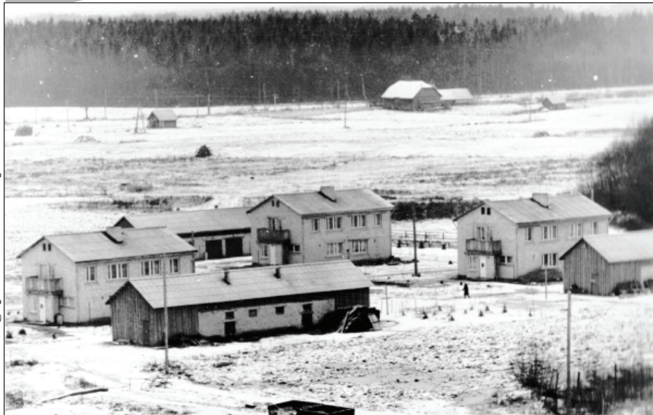
Liepu iela 80. gados.