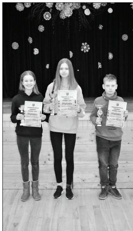
Godalgoto vietu ieguvēji bērnu un pusaudžu grupā