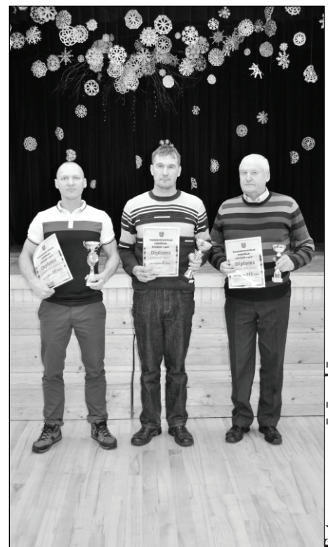
Godalgoto vietu ieguvēji pieaugušo grupā