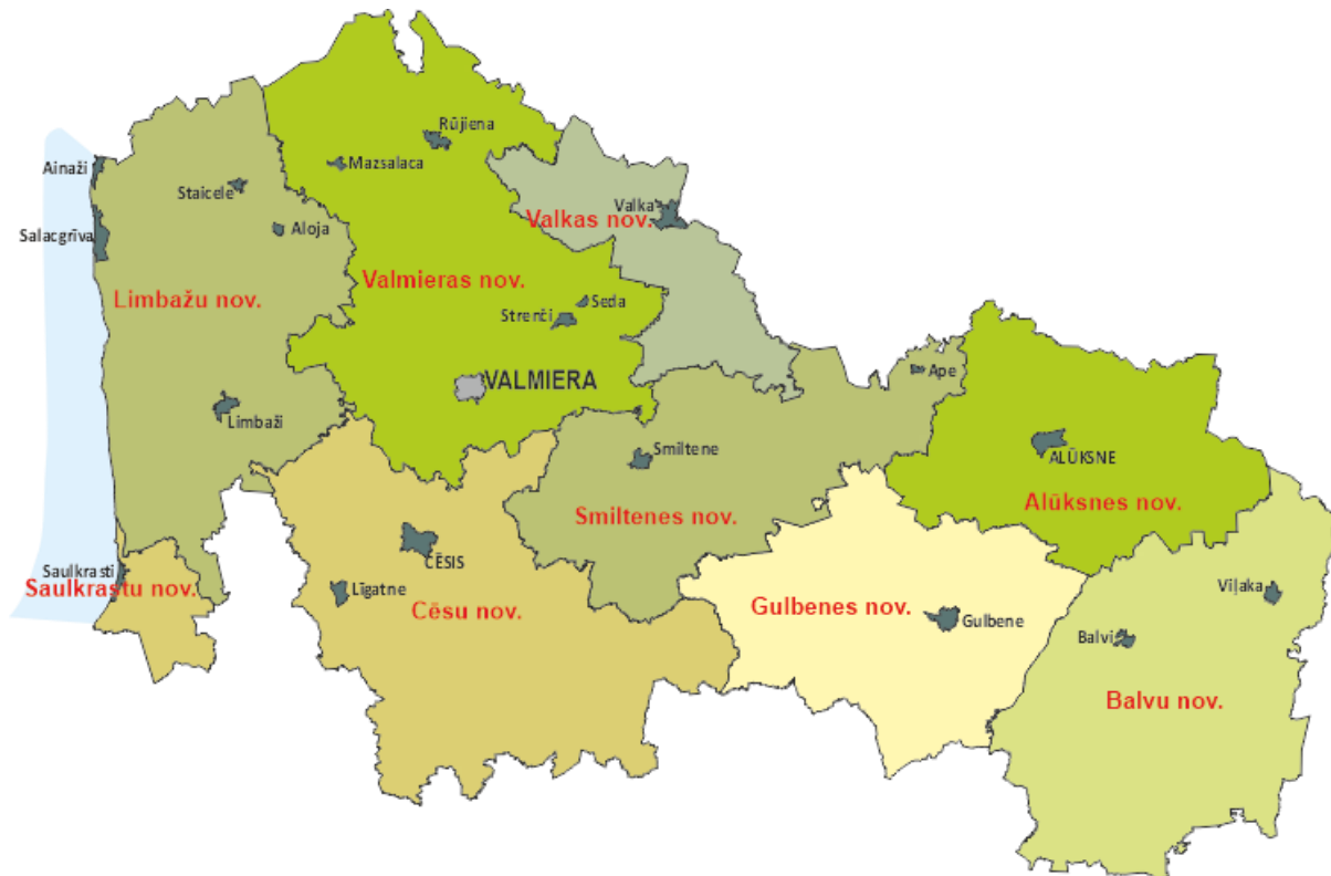
Attēls 2-1 Vidzemes AAR – administratīvi teritoriālais iedalījums