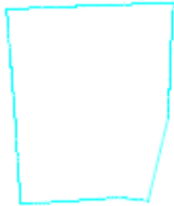
Projektētās teritorijas shēma pirms zemes ierīcības projekta izstrādes