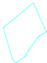
Projektētās teritorijas shēma pirms zemes ierīcības projekta izstrādes