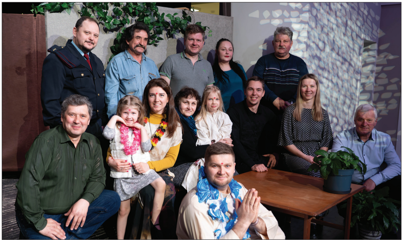
Baltinavas amatierteātris "Palādas" ir skatītāju mīlēts un cienīts visā Latvijā, visvairāk spēljošais Balvu novada amatierteātris, saņēmis daudzus apbalvojumus par savu darbošanos - pēdējais lielākais sasniegums - latgaliešu kultūras gada balvas "Boņuks 2023" - publikas simpātiju balva - "Žyks". Balvu novada amatierteātru skate ieguva Augstākās pakāpes diplomu.

Ar pirmās pakāpes diplomiem tika novērtēti: Žiguru Kultūras nama amatierteātris "Virši" par iestudējumu A. Danča "Pūramolys pučis" (Nav rūžu bez ēršķeizu!), režisore Valentīna Kaļāne; Viļakas Kultūras