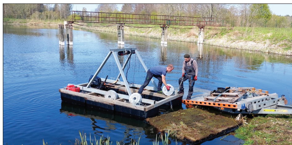
Enkura uzsliekšana/uzstādīšana peldošai salai.

Peldošās salas biodīķos kalpos kā peldoši ūdens attīrītāji, jo ir kā aktīvs bioloģiskais filtrs, kas palīdz samazināt slāpekļa un fosfora daudzumu. Augiem uz peldošās salas slāpekļis un fosfors ir kā barības viela. Augi šīs vielas patērē, uzņem