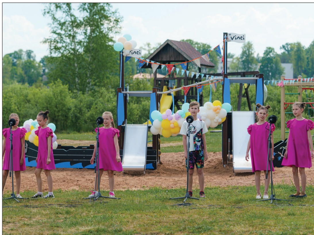
Kuģīša atklāšanas svētkos priecēja Viļakas Kultūras nama bērnu vokālais ansamblis "Pogas".