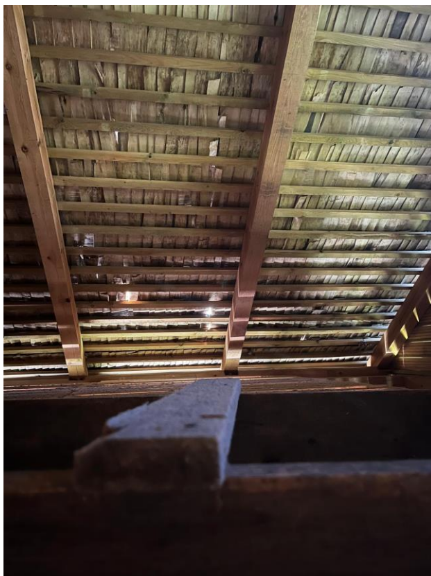
Josla Dienvidu jumta plaknē, kurā ir vislielākie bojājumi