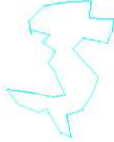
PROJEKTĒTĀS TERITORIJAS SHEMA PĒC ZEMES IERĪCĪBAS PROJEKTA IZSTRĀDES

lēmumam "Par zemes ierīcības projekta apstiprināšanu, lietošanas mērķu un apgrūtinājumu noteikšanu Balvu novada, Susāju pagasta nekustamā īpašuma "Kirupis Povasars" zemes vienības ar kadastra apzīmējumu 3878 010 0223 sadalei" (Protokols Nr. 6, 4.§)