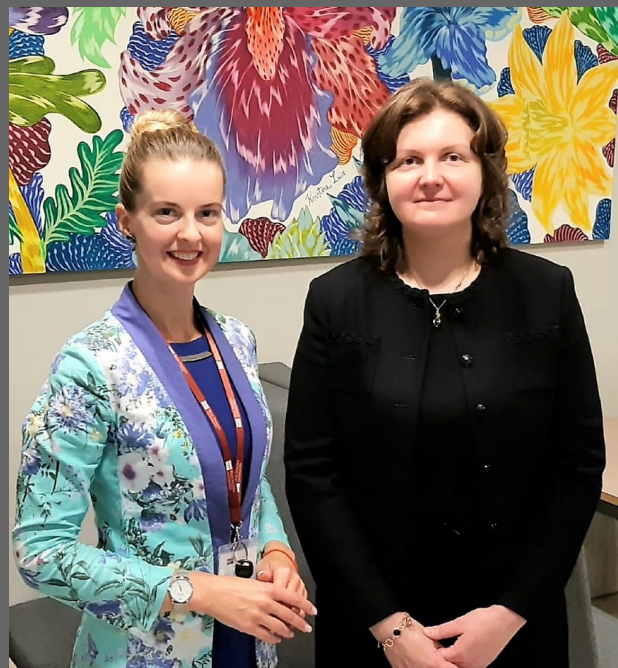
ar doktora grāda pretendenti pēc promocijas padomes sēdes; Laura kreisajā pusē