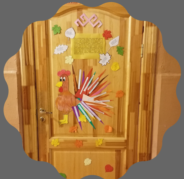
1.-4. klases durvju noformējums Mārtiņdienā

Priecājamies par viņu jaukajiem darbiņiem un aktivitātēm! Paldies audzinātājām par izdomu un vecākiem par atbalstu!