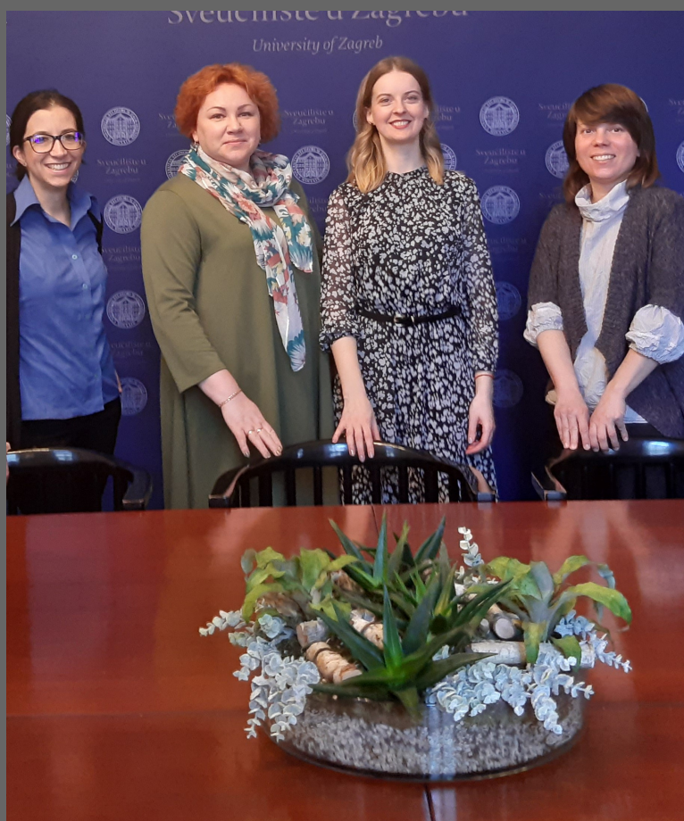
ERASMUS+ vizīte Horvātijā, Zagrebas universitātē

Tā kā darbs ir administratīvs, tad studijas sociālajās zinātnēs, humanitārajās zinātnēs būtu pluss, piesakoties šāda veida darbam.