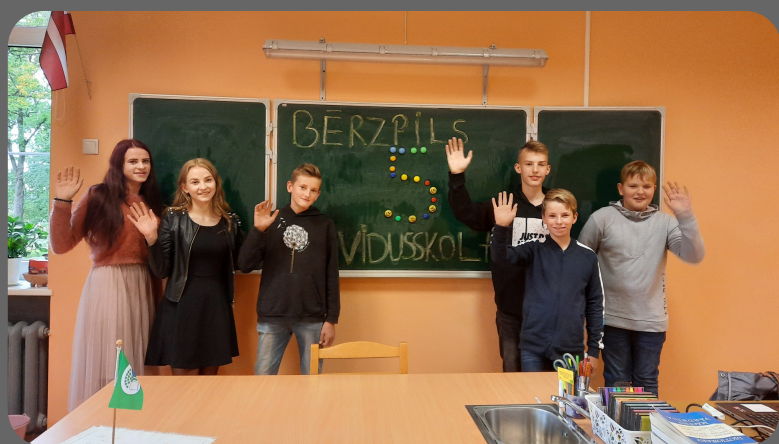
Eko padome apbalvošanas ceremonijas laikā