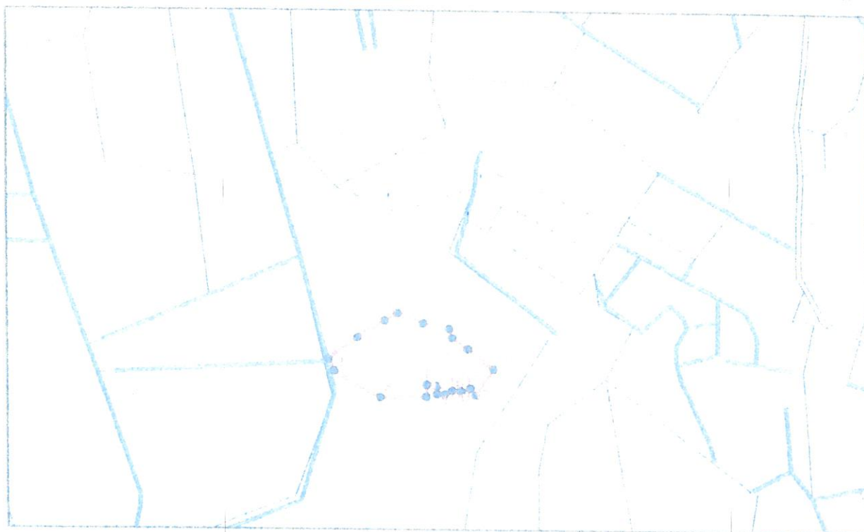
Cirsmas uzmērīšanas dati LKS 92 koordinātu sistēmā